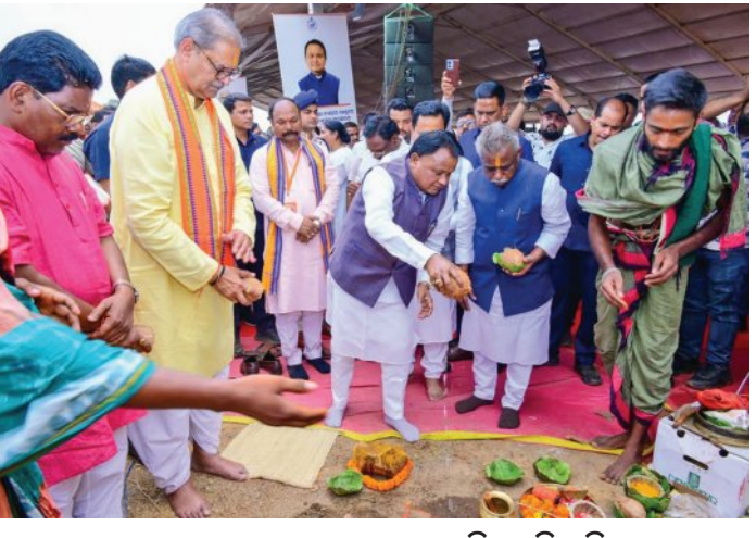
୬ ଲକ୍ଷରୁ ଅଧିକ ଉପଭୋକ୍ତା ପାଇବେ ନିରବଚ୍ଛିନ୍ନ ବିଦ୍ୟୁତ୍ ୨୦୩୬ ସୁଦ୍ଧା ରାଜ୍ୟରେ ନିର୍ମିତ ହେବ ଆହୁରି ୩୪ଟି ନୂଆ ଗ୍ରୀଡ଼ ବିଦ୍ୟୁତ୍ କାର୍ ହେବ; 'ହର୍ଷଲାଇନ ମେଣ୍ଟୋନାନ୍ସ' ମାଧ୍ୟମରେ ମରାମତି