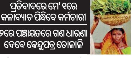
ପ୍ରତିବାଦରେ ମେ' ୧ରେ କଳାବ୍ୟାଜ ପିଛେ କର୍ମଚାରୀ ୨ରେ ପିଆଇଆଇରେ ଗଣଧାରଣା ଦେବେ କେନ୍ଦ୍ରପତ୍ର ଡୋକାଳି