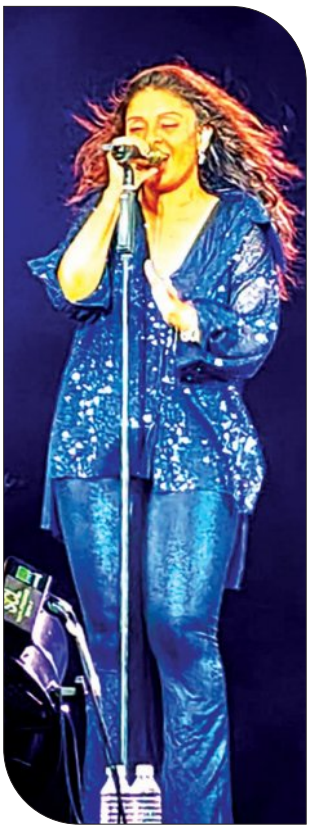
ଅନୁଗୋଳ, ୨୦।୪ (ସମ୍ପାଦକ):