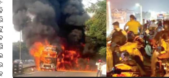
୧୬ ଆମ୍ବୁଲାନ୍ସରେ ଫସିଲେ ରୋଗୀ; ଭିଡ଼ରେ ଆକ୍ସିମାକ୍ସା ଯାତ୍ରୀ ଅଭାବ ସମୟରେ ଧୂଆଁ ହୋଇଗଲା ଲକ୍ଷାଧିକ ଲିଟର ତେଲ

■ ଭୁବନେଶ୍ୱର, ୨୨।୪ (ସମିପ): ଭୁବନେଶ୍ୱର-କଟକ ରାସ୍ତାର ପକାଣ୍ଡି ନିକଟରେ ଆଜି ଅପରାହ୍ଣ ପ୍ରାୟ ୩ଟା ବେଳେ ହୁହୁହୁଡ଼ କରି ଜଳିଗଲା ଗୋଟିଏ ଗାଡ଼ି । କଟକ ପଟୁ ଆସୁଥିବା ବେଳେ ପକାଣ୍ଡି ଗଲୁଆ ନାଳ ସେତୁ ନିକଟରେ ଏକ ଟ୍ରକରେ ନିଆଁ ଲାଗି ଯାଇଥିଲା । ଏହି ସମୟରେ ଗାଡ଼ିର ତେଲ ଟାଙ୍କି ଫାଟିଯିବାକୁ ତେଲ ରାସ୍ତା ଉପରେ ବୋହି ସେଥିରେ ବି ନିଆଁ ଧରିଥିଲା । ଟ୍ରକ ସହ ରାସ୍ତା ଉପରେ ବୋହୁଥିବା ତେଲ ବି ହୁହୁହୁଡ଼ କରିବାରେ ଲାଗିଲା । ଖବର ପାଇ କିଛି ସମୟ ପରେ ଅଗ୍ନିଶମ ବାହିନୀ ଘଟଣାସ୍ଥଳରେ ପହଞ୍ଚି ନିଆଁକୁ ଆୟତ୍ତ କରିଥିଲା । ଏହି ଅଗ୍ନିକାଣ୍ଡରେ