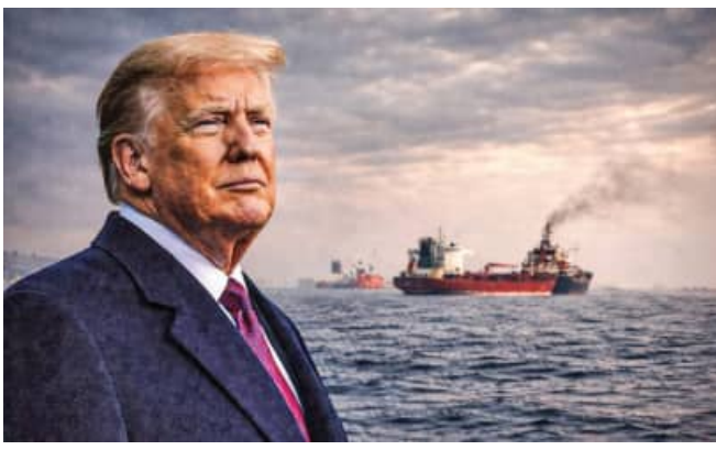
ଆମେରିକା ସେନାର ହର୍ମୁଜ ଅବରୋଧ ଜାରି ତୈଳ ଜାହାଜ ଉପରେ ଗୁଳିମାଡ଼ କରୁଛି ଜରାନ

■ ଝାଞ୍ଜିନେ/ଇସଲାମାବାଦ, ୨୨।୪ (ଏକେନ୍ଦ୍ରି): ଭରାନ ଓ ଆମେରିକା ମଧ୍ୟରେ ୧୫ ଦିନିଆ ଯୁଦ୍ଧ ବିରତି ଆଜି ଶେଷ ହୋଇଥିବା ବେଳେ ଏହାର ଅବଧିକୁ ଅନିର୍ଣ୍ଣ କାଳ ପାଇଁ ବୃଦ୍ଧି କରିବାକୁ ଘୋଷଣା କରିଛନ୍ତି ଆମେରିକାର ରାଷ୍ଟ୍ରପତି ଡୋନାଲ୍ଡ ଟ୍ରମ୍ପ । ଶାନ୍ତି ଆଲୋଚନା ପ୍ରକଳ୍ପ ନହେବା ପର୍ଯ୍ୟନ୍ତ ଯୁଦ୍ଧବିରତି ଜାରି ରହିବ । ଏହି ସମୟରେ ଦୁଇ ଦେଶ ମଧ୍ୟରେ ସାମରିକ ସଂଘର୍ଷ ହେବ ନାହିଁ, ତେବେ ହର୍ମୁଜରେ ଆମେରିକାର ନୌସେନା ଅବରୋଧ ଜାରି ରହିବ । ଆମେରିକାର ଏଭଳି ଆଭିମୁଖ୍ୟକୁ ନେଇ ଜରାନ ଭାଷଣ ପ୍ରତିକ୍ରିୟା ପ୍ରକାଶ କରିବା ସହିତ ହର୍ମୁଜରେ କେତେକ ଜାହାଜ ଉପରେ ଗୁଳିମାଡ଼