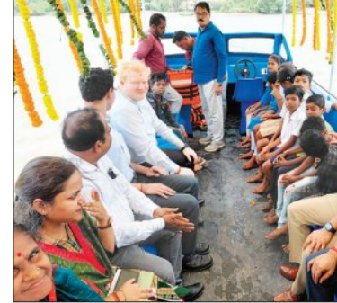
ସୁରକ୍ଷା ବ୍ୟବସ୍ଥା ନଥିଲା। ଏହି ଦୈନିକ ଯାତ୍ରା କେବଳ ଛାତ୍ରଛାତ୍ରୀଙ୍କ ପାଇଁ ନୁହେଁ, ସାଧାରଣ ଲୋକମାନେ ଯେଉଁଠାରେ ଦୁଇତରଫା ଯାନ ନେଇ ଧରି, ଛାତ୍ରଛାତ୍ରୀ ଓ ସ୍ଥାନୀୟ ଲୋକମାନେ ହସ୍ତୁଆ ନଦୀ ପାର ହେବା ପାଇଁ ଅସୁବିଧିତ ଦେଖି ତତ୍କାଳ ନିର୍ଭର କରୁଥିଲେ। ଯେଉଁଥିରେ କୌଣସି

ପାରାଦୀପ, ୨୭/୪ (ସମ୍ବିଧ): ଛାତ୍ରଛାତ୍ରୀଙ୍କ ସୁରକ୍ଷା ଏବଂ ସମୁଦାୟ ଯାତାୟତ ସୁବିଧାକୁ ବୃଦ୍ଧିଲାଭ ପାଇଁ ଏକ ଗୁରୁତ୍ୱପୂର୍ଣ୍ଣ ପଦକ୍ଷେପ ଗ୍ରହଣ କରାଯାଇଛି। ଏହି ପଦକ୍ଷେପ ଆଜି ଜଗତସିଂହପୁର ଜିଲ୍ଲାରେ ଏରସମା ବୁକ ଅଞ୍ଚଳରେ ଦାହିବରା ଘାଟରେ ୨୪ ଆସନ ବିଶିଷ୍ଟ ପାଖରବୋର୍ ଉଦ୍ଘାଟନ କରାଯାଇଛି। ଏହି ପଦକ୍ଷେପର ଉଦ୍ଦେଶ୍ୟ ହେଉଛି ଧୋବେଇ ଜଙ୍ଗଲ ରେଳପଥ ଭିତ୍ତିରେ ଅନ୍ତର୍ଗତ କାପା ଗ୍ରାମପଞ୍ଚାୟତର ଝାଡ଼ିପାରି ଏବଂ ଦାହିପାରି ଗ୍ରାମର ଛାତ୍ରଛାତ୍ରୀଙ୍କୁ ସୁରକ୍ଷିତ ଓ ନିର୍ଭରଯୋଗ୍ୟ ଯାତାୟତ ସୁବିଧା ପ୍ରଦାନ କରିବା। ଏହି ଛାତ୍ରଛାତ୍ରୀ ପ୍ରତିଦିନ ଅର୍ଧିକ ଗ୍ରାମ ପଞ୍ଚାୟତରେ ଅବସ୍ଥିତ ଅର୍ଧିକ ହାଇସ୍କୁଲ ଏବଂ ସରକାରୀ ଉଚ୍ଚ ପ୍ରାଥମିକ ବିଦ୍ୟାଳୟକୁ ଯାତ୍ରା କରନ୍ତି। ଦାହିପାରି ଏବଂ ଦାହିପାରି ବିଦ୍ୟାଳୟକୁ ଯାତ୍ରା କରନ୍ତି। ଦାହିପାରି ଏବଂ ଦାହିପାରି ବିଶିଷ୍ଟ ପାଖରବୋର୍ ଉଦ୍ଘାଟନ କରାଯାଇଛି। ଏହି ପଦକ୍ଷେପର ମୁଖ୍ୟମନ୍ତ୍ରୀ ଉପସଭାପତି ସୁରକ୍ଷା ମାନକ ଅନୁସାରେ