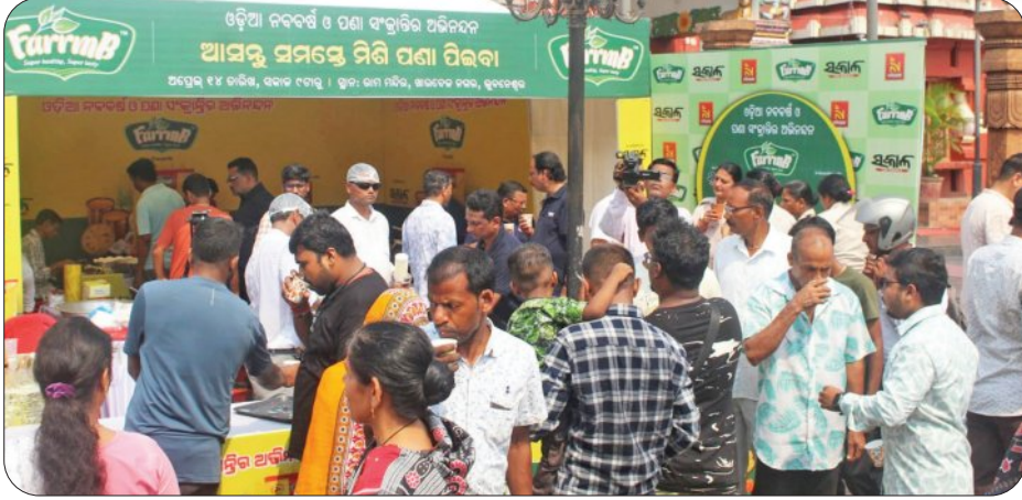
ପ୍ରସିଦ୍ଧ ଶାନ୍ତୀ ସାମଗ୍ରୀ ପ୍ରସ୍ତୁତକାରୀ ଫାଷ୍ଟା 'ପାର୍ଟି' ଏବଂ 'ସକାଳ ଓ ନନ୍ଦିଘୋଷ ଚିତ୍ତି' ପକ୍ଷରୁ ପକ୍ଷରୁ ଓଡ଼ିଆ ନବବର୍ଷ ଅବସରରେ ପଣା ବଣ୍ଟନ କାର୍ଯ୍ୟକ୍ରମ। ଭୁବନେଶ୍ୱରସ୍ଥିତ ରାମଚନ୍ଦ୍ର ନିକଟରେ ସକାଳ ୮ ଠାରୁ ଅପରାହ୍ଣ ୪ଟା ପର୍ଯ୍ୟନ୍ତ ଏହି କାର୍ଯ୍ୟକ୍ରମ ଚାଲିଥିଲା। ପ୍ରାୟ ୬ ହଜାରରୁ ଊର୍ଦ୍ଧ୍ୱ ପଥରୀ ଓ ଶ୍ରଦ୍ଧାଳୁଙ୍କୁ ପଣା ବଣ୍ଟନ କରାଯାଇଥିଲା। ଭୁବନେଶ୍ୱର ମେୟର ସୁଲୋଚନା ଦାସ ପଣା ବଣ୍ଟନ କାର୍ଯ୍ୟକ୍ରମକୁ ଉଦଘାଟନ କରିଥିଲେ।