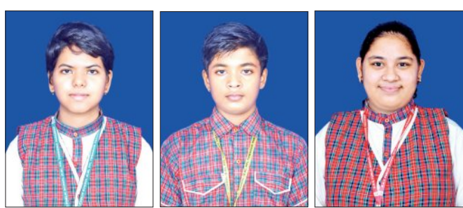
ପାରାଦୀପ, ୧୫୪ (ସମ୍ପାଦକ) : କେନ୍ଦ୍ରୀୟ ଦଶମ ଶ୍ରେଣୀ ପରୀକ୍ଷା ପାଠକ ଆଜି ପ୍ରକାଶ ମାଧ୍ୟମିକ ଶିକ୍ଷା ବୋର୍ଡ ଦ୍ୱାରା ଆୟୋଜିତ ପାଠକ । ଏହି ପରୀକ୍ଷାରେ ଡିଏଭି ପିପିଏଲର

ଦଶମ ଶ୍ରେଣୀ ପରୀକ୍ଷା ପାଠକ ଆଜି ପ୍ରକାଶ ମାଧ୍ୟମିକ ଶିକ୍ଷା ବୋର୍ଡ ଦ୍ୱାରା ଆୟୋଜିତ ପାଠକ । ଏହି ପରୀକ୍ଷାରେ ଡିଏଭି ପିପିଏଲର