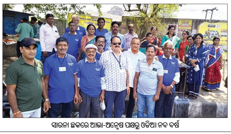
ସାରନା ଛକରେ ଆଭା-ଅନ୍ଦେଶ ପକ୍ଷରୁ ଓଡ଼ିଆ ନବ ବର୍ଷ