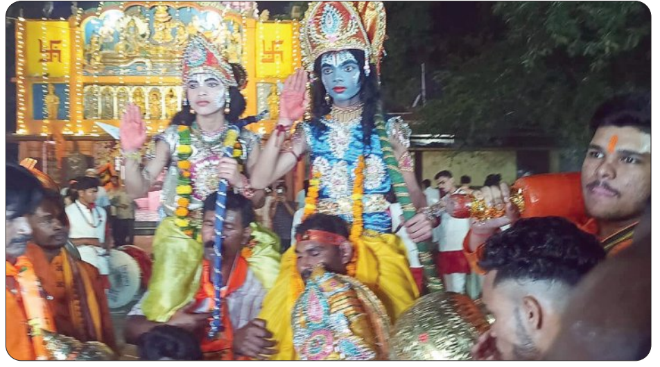
ସମ୍ବଲପୁର, ୧୪୪ (ସମିଧ)

କଋଣ ଶ୍ରୀରାମ, କଋଣ ହନୁମାନ ସ୍ଵରରେ ପ୍ରକାଶିତ ହେଲା ସମ୍ବଲପୁର ସହର। ଛୋଟରୁ ବଡ଼ ସମସ୍ତେ ହାତରେ ଝଣ୍ଡା ଧରି କଋଣ ହନୁମାନ ନାରୀ ଦେଲେ। ହନୁମାନ ସମ୍ବଲପୁର ସମିତି ପକ୍ଷରୁ ଆୟୋଜିତ ହନୁମାନ ଜୟନ୍ତୀ ଶୋଭାଯାତ୍ରାରେ ହଜାର ହଜାର ଶ୍ରଦ୍ଧାଳୁ ସାମିଲ ହୋଇଥିଲେ। ବୁଦ୍ଧିଲକ୍ଷ୍ମୀ ହିତ ହନୁମାନ ମନ୍ଦିରରେ ଆଳତା ହୋଇଥିଲା। ପରେ ଜିଲ୍ଲା ସ୍କୁଲରୁ ଶୋଭାଯାତ୍ରା ବାହାରିଥିଲା। ବିଭିନ୍ନ ପଢ଼ାଳୁ ଶ୍ରଦ୍ଧାଳୁମାନେ ଶୋଭାଯାତ୍ରା ଧରି ମୁଖ୍ୟ ଶୋଭାଯାତ୍ରାରେ ସାମିଲ ହୋଇଥିଲେ। ସେଠାରୁ ବାହାରିଥିଲା ଶୋଭାଯାତ୍ରା। ପୁଲିସ ପକ୍ଷରୁ ମଧ୍ୟ ବ୍ୟାପକ ସୁରକ୍ଷା ବ୍ୟବସ୍ଥା କରାଯାଇଥିଲା। ତ୍ରୋନ, ସିସିଟିଭିରେ ତାଙ୍କୁ ଭାବେ ନଜର ରଖାଯାଇଥିଲା। ୨୦୨୩ ମସିହାର ପୁନରାବୃତ୍ତି ଯେପରି ନ ହୁଏ ସେଥିପ୍ରତି ପୁଲିସ ପକ୍ଷରୁ ପ୍ରସ୍ତୁତି କରାଯାଇଥିଲା। ଶାନ୍ତି ଶୁଖିଲାର ସହ ଶୋଭାଯାତ୍ରା ଶେଷ ହୋଇଥିଲା।