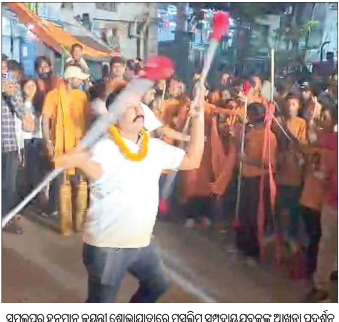
ସମ୍ବଲପୁର ହନୁମାନ ଜୟନ୍ତୀ ଶୋଭାଯାତ୍ରାରେ ମୁସଲିମ୍ ସମ୍ପ୍ରଦାୟରୁ ବକ୍ତୃତା ପ୍ରଦର୍ଶନ