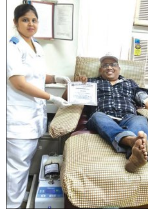
ନେଇ ସାମାଜିକ ଗଣମାଧ୍ୟମରେ ମହାରାଷ୍ଟ୍ରର ରାଜ୍ୟପାଳ ଓ ମୁଖ୍ୟମନ୍ତ୍ରୀ