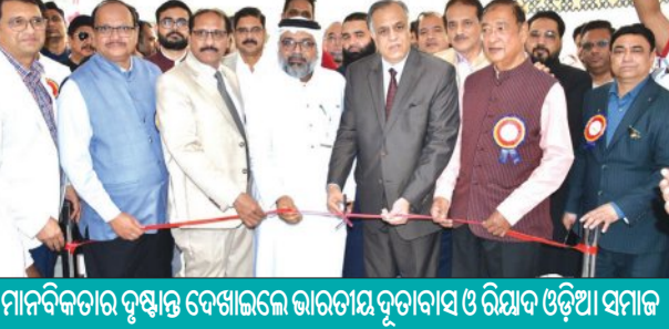
ମାନବିକତାର ଦୃଷ୍ଟାନ୍ତ ଦେଖାଇଲେ ଭାରତୀୟ ଦୂତାବାସ ଓ ରିୟାଜ ଓଡ଼ିଆ ସମାଜ