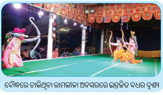
ବୌଦ୍ଧରେ ଚାଲିଥିବା ରାମଲୀଳା ଅବସରରେ ଛନ୍ଦିତ ବଧୂର ଦୃଶ୍ୟ