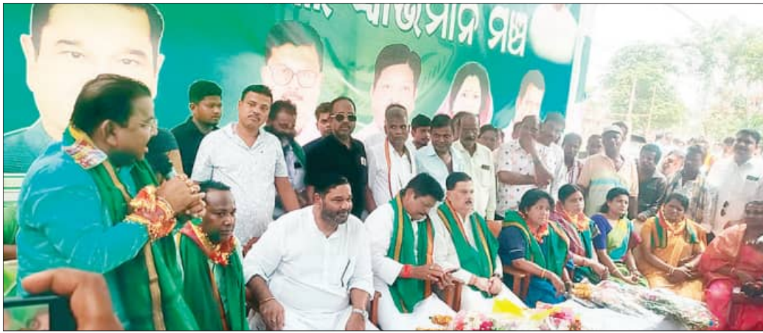
ତିର୍ତ୍ତୋଲ, ୨୨୧୪ (ସମିପ)