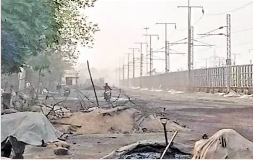
ତାରପୋଲିନ୍‌ରେ ଭାଙ୍ଗି ଯାଇଥିବା ନିର୍ଦ୍ଦେଶ କରିବା ପାଇଁ ଏବେ କମ୍ୟୁନିଟି ସହ ୧ ମାସର ରେକର୍ଡ଼ ବ୍ୟବସ୍ଥା କରିବାକୁ ହେବ । ସାଇଡ଼ିଂ ବାଉଁଶର ସାମାନ୍ୟତା ଅନୁମତି ପ୍ରଦାନ କରିବାକୁ ହେବ ।

ସୂକ୍ଷ୍ମ ରୋଡ୍ ରେଲୱେ ସାଇଡ଼ିଂ ଯୋଗୁଁ ବ୍ୟାପକ ବାୟୁ ଓ ଜଳ ପ୍ରଦୂଷଣ ହେଉଥିବା ନେଇ ବାରମ୍ବାର ଅଭିଯୋଗ ହେଇଆସୁଛି । ଏଥିନେଇ କଳିଙ୍ଗ ନଗର ଅଞ୍ଚଳିକ ପ୍ରଦୂଷଣ ନିୟନ୍ତ୍ରଣ ବୋର୍ଡ଼ ପକ୍ଷରୁ ଏକ ନିର୍ଦ୍ଦେଶନାମା ଜାରିକରାଯାଇଛି । ଏଥିରେ ୩୦ ତାରିଖ ମଧ୍ୟରେ ଏହି ନିର୍ଦ୍ଦେଶନାମାକୁ ନ ମାନିଲେ ସୂକ୍ଷ୍ମ ରୋଡ୍ ରେଲୱେ ସାଇଡ଼ିଂକୁ ବନ୍ଦ କରିଦିଆଯିବ ବୋଲି ଏଥିରେ ଉଲ୍ଲେଖ ରହିଛି ।