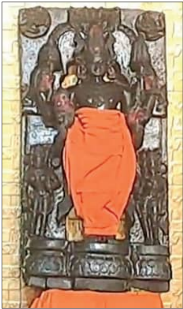
ଯାଜପୁର/କୁଆଖୁଆ, ୧୮୪ (ସମିପ)

ରଘୁଲପୁର ବୁକ୍ ବିଜ୍ଞାନପୁର ପ୍ରଭୁ ନାରାୟଣ ଗୋସେଇଁଙ୍କ ଯାତ୍ରା କାର୍ଯ୍ୟକ୍ରମ ଯୁଗର। ଶହ ଶହ ବର୍ଷ ଧରି ଏଠାରେ ପ୍ରଭୁ ନାରାୟଣ ଗୋସେଇଁଙ୍କ ପୂଜା ହୋଇଆସୁଛି। ବର୍ଷର ମାତ୍ର ୩ ଦିନ ମଧ୍ୟ ପୁଷ୍କରିଣୀରୁ ବାହାରି ନାରାୟଣ ଗୋସେଇଁ ମନ୍ଦିରକୁ ଯାଇଥାନ୍ତି। କିନ୍ତୁ ଚଳିତ ବର୍ଷ ଏହି ପରମ୍ପରାକୁ ଭଙ୍ଗ କରାଯାଇ ୪ ଦିନ କରାଯିବାକୁ ନେଇ ବିବାଦ ଦେଖାଦେଇଛି। ଉକ୍ତ ଓ ଶ୍ରଦ୍ଧାଳୁ ମାନଙ୍କୁ ସ୍ଥଳଦେଶ ମନ୍ଦିରରେ ବର୍ଷର ବେଳା ପରେ ଶନିବାର ସକାଳ ୭ ମାଃରେ ନିକଟସ୍ଥ ମଧୁପୁରୀ ପୁଷ୍କରିଣୀ ଜଳକୁ ଗମନ କରିଥିଲେ। ମହାପ୍ରଭୁଙ୍କ ସ୍ଥଳ ଦେଶ ପୂଜା ଅର୍ଚ୍ଚନା ସମୟରେ ୧୩ ବେଶରେ ଭୂଷିତ ହୋଇଥିଲେ। ଜଳ ଗମନ ସକାଳେ ଦିନ ପ୍ରତ୍ୟକ୍ଷରୁ ବିଧି ପୂର୍ବକ ପାରମ୍ପରିକ ପୂଜାର୍ଚ୍ଚନା କରାଯାଇ ମଧୁପୁର ଗଡ଼ଜାତ ରାଜ ପରିବାରର ଦାୟତ୍ତ ଅପଣା ଧାର ଦି ଉତ୍ତରୀନ ପୁଷ୍କାଳି