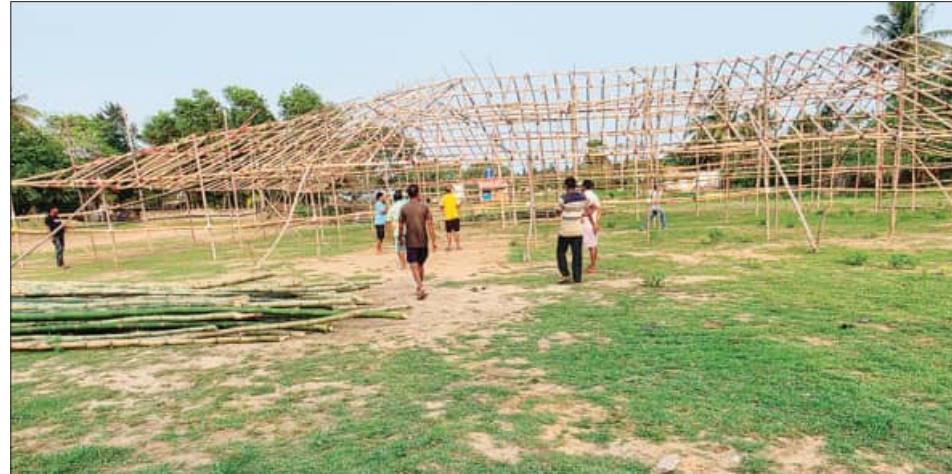
ପରେ ହାପି କୁଦ ଗତ ମାସ ୧୫ ତାରିଖରେ ଲଚେଟା କରିବା ସହିତ ୨୦ରୁ ୨୪ ତାରିଖ ମଧ୍ୟରେ ୫ ଦିନିଆ ମୁକ୍ତମଞ୍ଚ ନାଟକ ପ୍ରତିଯୋଗିତା ଆୟୋଜନ ନେଇ ଘୋଷଣା କରିଥିଲେ । ଏହି କୁଦ ୭ ବର୍ଷ ଧରି ଏହିପରି ପ୍ରତିଯୋଗିତା ଆୟୋଜନ କରିଆସୁଥିବା ବେଳେ ଗତ ୨ ବର୍ଷ ଧରି ନାରବ ରହିଥିଲା । ଯାହାକୁ ନେଇ ଉଭୟ ଅନୁଷ୍ଠାନ ମଧ୍ୟରେ ବିବାଦ ସୃଷ୍ଟି ହୋଇଥିଲା । ଉଭୟ ଦଳ ନିଜନିଜର ପ୍ରସ୍ତୁତିରେ ବ୍ୟସ୍ତ ରହିଛନ୍ତି । ତେବେ ପ୍ରଥମ ଓ ଦ୍ୱିତୀୟ ଅନୁଷ୍ଠାନ ମଧ୍ୟରେ ମାତ୍ର ୪ ଦିନ ବ୍ୟବଧାନ ରହୁଥିବାରୁ

ପ୍ରକାଶ ଯେତେମାସ ୮ ତାରିଖରେ କାଳିଆପାଟଣା ସାଂସ୍କୃତିକ ମଞ୍ଚ ପକ୍ଷରୁ ପ୍ରଥମେ ଅପ୍ରେଲ ୨୮ ରୁ ମେ ୨ ତାରିଖ ପାଞ୍ଚଦିନ ଧରି ମୁକ୍ତମଞ୍ଚ ନାଟକ ପ୍ରତିଯୋଗିତା ଅନୁଷ୍ଠିତ ହେବା ନେଇ ଘୋଷଣା କରାଯାଇଥିଲା । ଅଞ୍ଚଳ ଗ୍ରହଣକାରୀ ସାଂସ୍କୃତିକ ଦଳ ମଧ୍ୟରେ ଲଚେଟା ଜରିଆରେ କେହି ଦଳ କେହିଦିନ ନାଟକ ପରିବେଷଣ କରିବ ତାହା ନିର୍ଦ୍ଧାରଣ କରିଥିଲେ । ମାତ୍ର ଏହାର ଏକ ସମ୍ପାଦ