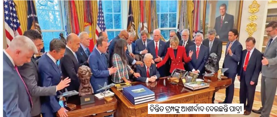
ଚିନ୍ତିତ ଟ୍ରମ୍ପଙ୍କୁ ଆଶୀର୍ବାଦ ଦେଉଛନ୍ତି ପାତ୍ର

ନୂଆଦିଲ୍ଲୀ, ୨୩(ଏକେନ୍ଦ୍ରି): ମଧ୍ୟପ୍ରାନ୍ତରେ ରାଜିଥିବା ଆମେରିକା- ଇସ୍ରାଏଲ ଏବଂ ଇରାନ ମଧ୍ୟ ୨ ଦିନରେ ପହଞ୍ଚିଛି । ଏହି ମୁକ୍ତ ବେଶ୍ ଉଦ୍ଧାର ହେବାରେ ଲାଗିଛି । ଏହାର ନକରାମୂଳକ ପ୍ରକାର ସାରା ବିଶ୍ୱକୁ କବଳିତ କରିବାକୁ ଯାଉଛି । ପ୍ରଥମେ ଇରାନର ନେତୃତ୍ୱ ଓ ପରମାଣୁ କେନ୍ଦ୍ର ଟାର୍ଗେଟ କରି ଆରମ୍ଭ ହୋଇଥିବା ଏହି ସଂଘର୍ଷ ୨୦ଟି ଦେଶକୁ ବ୍ୟାପି ଯାଇଛି । ଇସ୍ରାଏଲ ଏବଂ ଇରାନ ଆକ୍ରମଣରେ କେବଳ ଇରାନରେ ୧୩୩୨ରୁ ଅଧିକ ଲୋକଙ୍କ ମୃତ୍ୟୁ ହୋଇଛି । ଏଥିରେ ୧୨୫ ଜଣ ଶିଶୁ ମଧ୍ୟ ମୃତ୍ୟୁ ହୋଇଛି । ଏ ପର୍ଯ୍ୟନ୍ତ ଇରାନରେ ୧୩୦୦ ଠିକଣାକୁ ନିଶାଣ କରି ଆକ୍ରମଣ ହୋଇଛି । ୧୪ ମେଡିକାଲ କେନ୍ଦ୍ର ଉପରେ ମଧ୍ୟ ସେପଟାସ୍ତ୍ର ମାଡ଼ କରାଯାଇଛି । ଏଥିଯୋଗୁଁ ଇରାନର ଅନେକ ସ୍ଥାନରେ ବିଦ୍ୟୁତ ଏବଂ ଜଳ ଯୋଗାଣ ବନ୍ଦ ହୋଇଯାଇଛି । ସେହିପରି