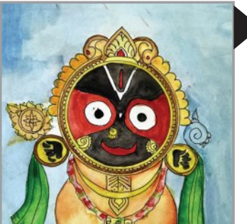
ଅଭିକାଶ ଦାଶ, ଦଶମ ଶ୍ରେଣୀ ବଲାଙ୍ଗିର ପୂର୍ବିକ ସ୍କୁଲ ବଲାଙ୍ଗିର