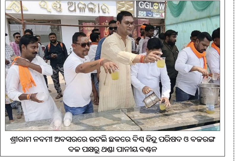
ଶ୍ରୀରାମ ନବମୀ ଅବସରରେ ଭଟ୍ଟଳି ଛକରେ ବିଷ୍ଣୁ ପରିଷଦ ଓ ବଜରଞ୍ଜ ଦଳ ପକ୍ଷରୁ ପଣ୍ଡା ପାନୀୟ ବଣ୍ଟନ