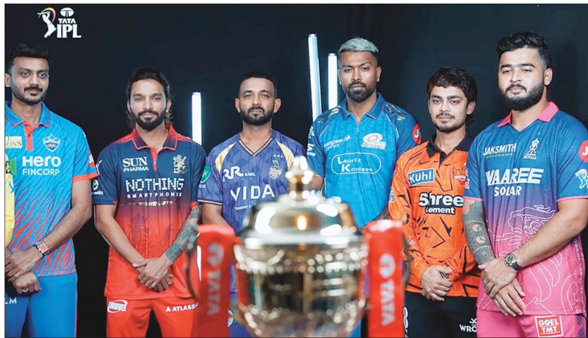
ବେଙ୍ଗାଳୁରୁ ୨୭ ମାର୍ଚ୍ଚ (ଏକେଡ୍)

ହାଇଦ୍ରାବାଦ ଲକ୍ଷ୍ମୀ ଆନନ୍ଦ ଲିଭ୍ (ଆଇପିଏଲ) ୧୯ତମ ସଂସ୍କରଣ ଆସନ୍ତାକାଲି ବା ଶନିବାରଠାରୁ ଆରମ୍ଭ ହେବ । ମଧ୍ୟପ୍ରାନ୍ତ ସ୍ଥଳର ବିଭାଗିକା ମଧ୍ୟରେ ଭାରତ ସମେତ ବିଶ୍ୱର କ୍ରିକେଟ୍ ପ୍ରଶଂସକ ପୁଣି ଥରେ ପଟାପଟା କ୍ରିକେଟର ମଜା ନେବାର ସୁଯୋଗ ପାଇବେ । ସପ୍ତରତ୍ନ ଭଳି ଏଥର ମଧ୍ୟ ଆଇପିଏଲ ସଫଳତାର ଶୀର୍ଷକୁ ଛୁଇଁବ ବୋଲି ଆଶା କରାଯାଉଛି । ଏଥର ଆଇପିଏଲକୁ ନେଇ ପ୍ରଶଂସକଙ୍କ ମଧ୍ୟରେ ପ୍ରବଳ ଉତ୍ସାହ ଦେଖିବାକୁ ମିଳିଛି । ମଧ୍ୟପ୍ରାନ୍ତୀୟ ସ୍ତର ପାଇଁ ବିଦେଶୀ ଖେଳାଳିଙ୍କ ଉପଲବ୍ଧତାକୁ ନେଇ କିଛି ତ୍ୟାଲେଞ୍ଜ ରହିଥିଲେ ମଧ୍ୟ ଭାରତୀୟ କ୍ରିକେଟ୍ କଣ୍ଠୋଳ ବୋର୍ଡ୍ (ବିସିଆଇ) ଏହି ଚୁକ୍ତିନାମାକୁ ସଫଳ କରିବା ପାଇଁ ସମସ୍ତ ପ୍ରୟତ୍ନ ଚୁଡ଼ାନ୍ତ କରିଛି । ସ୍ଥାନୀୟ ଏମ୍ ଚିଲ୍‌ସାମା ଷ୍ଟାଡିୟମରେ