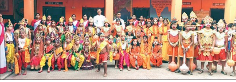
ଝାତୁଣ୍ଡା ବନବାସୀ ରାଜାରାମ, ସୀତା ଓ ଲକ୍ଷ୍ମଣ, ହନୁମାନ ବେଶରେ ସଜ୍ଜିତ ହୋଇଥିଲେ। ରଥରେ ବିଜେ ବାଜାର ତାଳେ ତାଳେ ନଗର ପରିକ୍ରମା କରିଥିଲେ। ଶ୍ରୀରାମ ଧ୍ୟାନରେ ବିଭିନ୍ନ ସ୍ଥାନରେ ଝୋଟି ତିଆରି ପକାଇ କଳସ ସ୍ଥାନ କରି ସ୍ୱାଗତ କରିଥିଲେ।