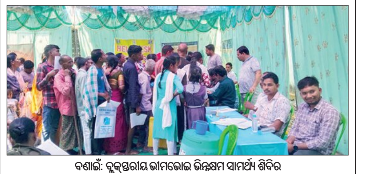
ବର୍ଷାକ: ବ୍ଲକସ୍ତରୀୟ ଜାମିନର ଉନ୍ନତ ସାମର୍ଥ୍ୟ ଶିବିର

କୋମନା, ୧୩ ମାର୍ଚ୍ଚ (ସମିତି): ନୂଆପଡ଼ା ଜିଲ୍ଲା କୋମନା ଥାନା ସୁନ୍ଦରନଦୀ କୂଳରେ ଥିବା ଦେଓ ମହନା ସୁଶାନ୍ତନାଥ ନିକଟରୁ ଅତିଦୂର ଦୂରାନ୍ତ ଗଳିତ ଶବ ଉଦ୍ଧାର ହୋଇଛି। ମିଳିଥିବା ସୂଚନା ଅନୁଯାୟୀ, ସୁଶାନ୍ତନାଥ ନିକଟରେ ମୃତଦେହ ପଡ଼ିଥିବା ଲୋକେ ଦେଖିବାକୁ ପାଇ ପୁଲିସ୍କୁ ଖବର ଦେଇଥିଲେ। ଶବ ସମ୍ପୂର୍ଣ୍ଣ ପରିସର ଗଳିତ ଅବସ୍ଥାରେ ଥିବାରୁ ଏହା କିଛି ଦିନ ତଳର ବୋଲି ଅନୁମାନ କରାଯାଇଛି।