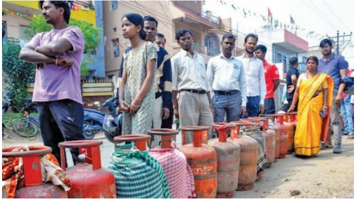
ଲାଗିଲା ଅତ୍ୟାବଶ୍ୟକ ସାମଗ୍ରୀ ଆଇନ ଅନେକ ରାଜ୍ୟରେ ବାଣିଜ୍ୟିକ ଗ୍ୟାସ୍ ଯୋଗାଣ ବନ୍ଦ

ନୂଆଦିଲ୍ଲୀ, ୧୦ମାର୍ଚ୍ଚ (ଏଜେନ୍ଟି): ଲଗାନ୍ ଯୁଦ୍ଧରେ ଭାରତରେ ରକ୍ଷଣ ଗ୍ୟାସ୍ ଯୋଗାଣ କ୍ଷେତ୍ରରେ ବଡ଼ ସଙ୍କଟ ସୃଷ୍ଟି ହୋଇଛି। ଦେଶର ଅଧିକାଂଶ ଭାଗରେ ଏଲ୍ପିଜି ସିଲିଣ୍ଡରର ଅଭାବ ଦେଖାଦେଇଛି। ସୋମବାର ସରକାର ଏଲ୍ପିଜି ରକ୍ଷଣ ଗ୍ୟାସ୍ ବୁକିଂ ନିୟମରେ ପରିବର୍ତ୍ତନ ପୂର୍ବକ ବୁକିଂ ଅବଧି ୨୧ ଦିନରୁ ୨୫ ଦିନକୁ ବୃଦ୍ଧି କରିବା ପରେ ସାରା ଦେଶରେ ଏଲ୍ପିଜି ସିଲିଣ୍ଡର ଉପଲବ୍ଧତାକୁ ନେଇ ଭାଲେଣ୍ଟି ପଡିଯାଇଛି। ଓଡ଼ିଶାରେ ବି ଖାରବିଳା ମଧ୍ୟରେ ରକ୍ଷଣ ଗ୍ୟାସ୍ ସଙ୍କଟ କୋରଦାର ଅନୁଭୂତ ହୋଇଛି। ରାଜଧାନୀ ଭୁବନେଶ୍ୱରରେ ଆରମ୍ଭ କରି କଟକ, ବ୍ରହ୍ମପୁର, ଜୟପୁର, ସମ୍ବଲପୁର, ରାଉରକେଲା, ଯାଜପୁର ଏବଂ ବାଲେଶ୍ୱର ଭଳି ପ୍ରମୁଖ ସହରଗୁଡ଼ିକରେ ରକ୍ଷଣ ଗ୍ୟାସ୍ ଅଭାବ ନେଇ ଲୋକଙ୍କ ମଧ୍ୟରେ ଖବର କୋରସୋର ପ୍ରସାରିତ ହୋଇଯାଇଅଛି। ଏମିତିକି ମଙ୍ଗଳବାର ସକାଳୁ ସକାଳୁ ଗ୍ୟାସ୍ ଏଜେନ୍ଟିଗୁଡ଼ିକ ଆଗରେ ଗ୍ରାହକଙ୍କ ଲମ୍ବା ଲାଇନ୍ ଦେଖିବାକୁ ମିଳିଛି। ଗ୍ୟାସ୍ ଅଭାବକୁ ରୋକି ଦିଲ୍ଲୀ, ମଧ୍ୟପ୍ରଦେଶ, ମହାରାଷ୍ଟ୍ର, ଉତ୍ତର ପ୍ରଦେଶ, ରାଜସ୍ଥାନ ଏବଂ ଛତିଶଗଡ଼ ସମେତ ଅନେକ ରାଜ୍ୟ ଅଧିକାଂଶ ଭାବରେ ବାଣିଜ୍ୟିକ