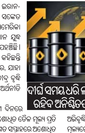
ଦୀର୍ଘ ସମୟ ଧରି ଲାଗି ରହିବ ଅନିଶ୍ଚିତତା

ନୂଆଦିଲ୍ଲୀ, ୮ମ (ଏକେଡ଼ି): ଇରାନ-ଇସ୍ରାଏଲ ଯୁଦ୍ଧ କମିବାର କୌଣସି ସଙ୍କେତ ଦେଖାଯାଉନାହିଁ। ଏହି ଯୁଦ୍ଧରେ ଆମେରିକା ମଧ୍ୟ ଇସ୍ରାଏଲ ସହତ ରହିଛି। ବର୍ତ୍ତମାନ ମୁକ୍ତ ଉପସାଗରୀୟ ଦେଶରେ ପର୍ଯ୍ୟନ୍ତ ପହଞ୍ଚିଛି। ଆମେରିକା ରାଷ୍ଟ୍ରପତି ତୋନାଲୁ ଗୁଟ୍ସ କହିଛନ୍ତି ଯେ ଏହି ଯୁଦ୍ଧ ଦୀର୍ଘକାଳୀନ ହୋଇପାରେ, ଯାହା ବିଶ୍ୱରେ ଅଶୋଧିତ ତୈଳ ମୂଲ୍ୟରେ ଡାକ୍ତରୀ ଆଣିବାର। ଏଥିଯୋଗୁ ଭାରତର ଅର୍ଥନୀତି ପ୍ରଭାବିତ ହେବାର ସମ୍ଭାବନା ରହିଛି। ଆଜି ଇରାନ-ଇସ୍ରାଏଲ ଯୁଦ୍ଧ ୯ମ ଦିନରେ ପହଞ୍ଚିଛି। ମୁକ୍ତ ଆରମ୍ଭ ହେବା ପୂର୍ବରୁ ଅଶୋଧିତ ତୈଳ ମୂଲ୍ୟ ପ୍ରତି ବ୍ୟାପକ ପ୍ରାୟ ୬୨ ଡଲାର ରହିଥିଲା। ଗତ ସପ୍ତାହରେ ଅଶୋଧିତ