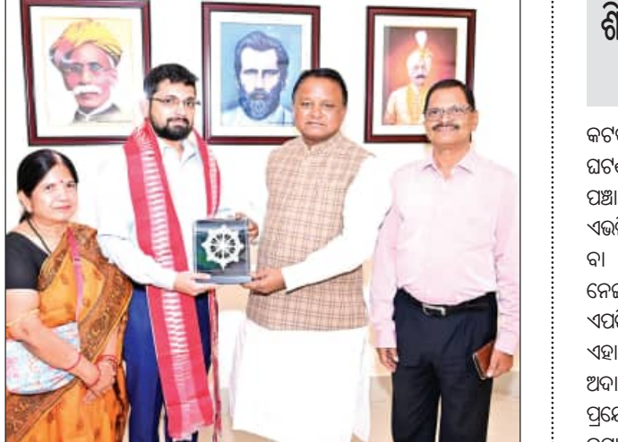
ସର୍ବଭାରତୀୟ ପୁଞ୍ଜାଳି ସେବା ପରାକ୍ଷରେ ୧୦୦୦ମ ଚ୍ୟାସ୍ ମୂଲ୍ୟରେ ଥିବା କେନ୍ଦ୍ରରେ ଜିଲ୍ଲାର ସାହିକ ସଂସ୍ଥାମାନ ଦେବଗଡ଼ ମୁଖ୍ୟମନ୍ତ୍ରୀ ମୋହନ ଚରଣ ମାଝି ଲୋକସେବା ଭବନରେ ସମ୍ପର୍କିତ କରୁଛନ୍ତି