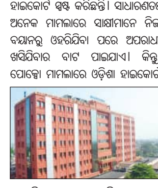
ପାଠିତାଙ୍କ ବୟାନ ଦୋଷୀକୁ ଦଣ୍ଡବିଧାନ ପାଇଁ ଯଥେଷ୍ଟ

କଟକ, ୭୩ (ସମ୍ପାଦକ): ଯୌନ ଅପରାଧରୁ ନାବାଳିକାକୁ ସୁରକ୍ଷା ଦେବା ପାଇଁ ପ୍ରଶାସନ 'ପୋଷାକ' ଆଇନର ବ୍ୟାଖ୍ୟା କରି ଉଡ଼ିଶା ହାଇକୋର୍ଟ ଏକ ଗୁରୁତ୍ୱପୂର୍ଣ୍ଣ ରାୟ ଶୁଣାଇଛନ୍ତି।