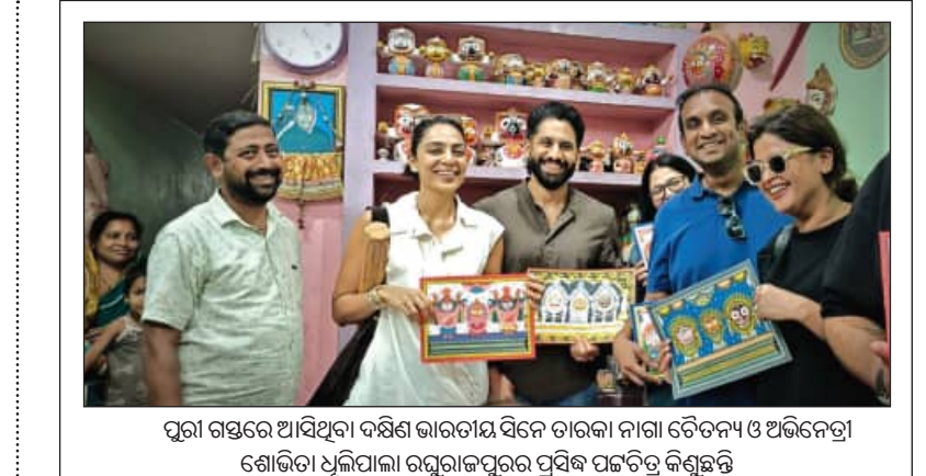
ପୁରୀ ଗସ୍ତରେ ଆସିଥିବା ଦକ୍ଷିଣ ଭାରତୀୟ ସିନେ ତାରକା ନାଗା ଚୈତନ୍ୟ ଓ ଅଭିନେତ୍ରୀ ଶୋଭିତା ଧୂଳିପାଲ।

ମାଙ୍କଡ଼, ୨ଟି ଅଣ୍ଡିରା ଓ ୨ଟି ମାଲ ଗୁରୁଣ୍ଡ ଏବଂ ଗୋଟିଏ ଅଣ୍ଡିରା ଓ ୨ଟି ମାଲ ହିଂସାଳ କୁସାରକୁ ସାଙ୍ଗରେ ନେଇ ଯାଇଛନ୍ତି।