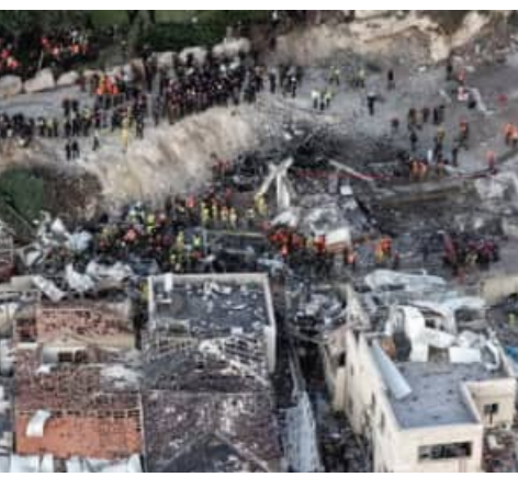
ଭୟଙ୍କର ଆକ୍ରମଣ ଅଭିଯାନ ଆରମ୍ଭ କରିବୁ: ଇରାନ ମୁକ୍ତପୋଡ଼ 'ଆବାହାମ୍ ଲିକନ୍' ଉପରେ କ୍ଷେପଣାସ୍ତ୍ର ମାଡ଼ ଇରାନ ଉପରେ ଆକ୍ରମଣକୁ ଚୀନ, ରଷ୍ଟ୍ର, ଉ.କୋରିଆର ନିନ୍ଦା ଅନ୍ତରାଷ୍ଟ୍ରୀୟ ସମ୍ପର୍କକୁ ନଷ୍ଟ କରିଛି ଆମେରିକା: ଚୀନ ଖାମନେଇଙ୍କ ହତ୍ୟା ବିରୋଧରେ ବିଭିନ୍ନ ଦେଶରେ ବିକ୍ଷୋଭ