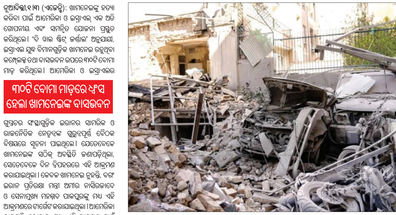
୩୦ଟି ବୋମା ମାଡ଼ରେ ଧ୍ୱସ୍ତ ହେଲା ଖାମନେଇଙ୍କ ବାସଭବନ

ନୁଆଦିଲ୍ଲା, ୧୩ (ଏକେନି): ଖାମନେଇଙ୍କୁ ହତ୍ୟା କରିବା ପାଇଁ ଆମେରିକା ଓ ଇସ୍ରାଏଲ ଏକ ଅତି ଗୋପନୀୟ ଏବଂ ସମ୍ପୂର୍ଣ୍ଣ ଯୋଜନା ପ୍ରସ୍ତୁତ କରିଥିଲେ । 'ଦି ଖାଲ ଷ୍ଟ୍ରିଟ୍ ଜର୍ଣ୍ଣାଲ୍' ଅନୁଯାୟୀ, ଇସ୍ରାଏଲୀ ସୁଦ୍ଧା ବିପ୍ଳବଗୁଡ଼ିକ ଖାମନେଇଙ୍କୁ ଉଦ୍‌ଘୋଷଣା କଲେବଳ ତଥା ବାସଭବନ ଉପରେ ୩୦ଟି ବୋମା ମାଡ଼ କରିଥିଲେ । ଆମେରିକା ଓ ଇସ୍ରାଏଲର ଗୁପ୍ତଚର ଏ ସମ୍ପର୍କରେ ଖାମନେଇଙ୍କୁ ଜଣାଇଥିଲେ । ଗୁପ୍ତଚର ରିପୋର୍ଟ ମୁତାବକ, ଇରାନ ଆମେରିକା ଯାତ୍ରା ଉପରେ ଆକ୍ରମଣ ଯୋଜନା କରୁଥିଲା । ଫଳରେ ଆମେରିକା ଏହି ପଦକ୍ଷେପ ନେଇଥିଲା । ଇରାନ ଖାମନେଇଙ୍କ ମୃତ୍ୟୁକୁ ନିଶ୍ଚିତ କରିବା ସହ ୪୦ ଦିନିଆ କାତାୟ ଶୋକ ଘୋଷଣା କରିଛି । ଖାମନେଇଙ୍କ ମୃତ୍ୟୁ ପରେ ଇରାନ ପୂର୍ଣ୍ଣ ସ୍ୱାଧୀନ ତଥା ମଧ୍ୟପ୍ରାନ୍ତରେ ଥିବା ଆମେରିକା ଯାତ୍ରା ଉପରେ ଆକ୍ରମଣ ପାଇଁ ଆକ୍ରମଣ କରିବାକୁ ତୋଡ଼ାବନା ଦେଇଛି । ଏହାର ଜବାବରେ ତୋନାଲ୍ ଟ୍ରମ୍ପ କହିଛନ୍ତି ଯେ ଯଦି ଆମେରିକା ଓ ଇସ୍ରାଏଲ ଉପରେ ଆକ୍ରମଣ ହୁଏ, ତେବେ ଇରାନ ପୂର୍ବରୁ କେବେ ଦେଖି ନଥିବା ଭଳି ଭୟଙ୍କର ପରିଣାମ ଘୋଷଣା କରିବେ ।