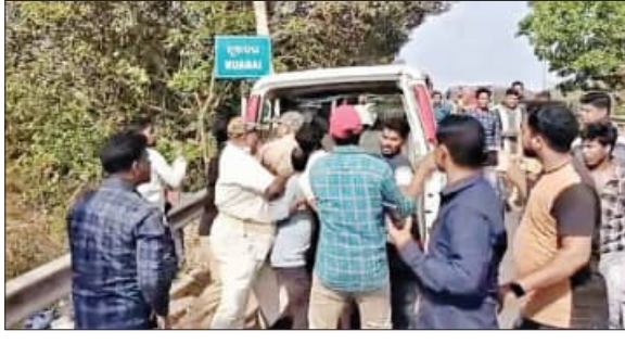
ଭିଡିଓ ଭାଇରାଲ୍; ଆନାରେ ମାମଲା

ଘଟଣାସ୍ଥଳୀରେ ପୁରୀ-କୋଣାର୍କ ବେଳାକୁମ୍ଭୀ ରାସ୍ତାର ନୂଆନଳରେ ଦୀର୍ଘ ସମୟ ଖୋଜାଖୋଜି କରିଥିଲେ। ଏହି ସମୟରେ କିଛି ଉତ୍ସୁକ ଲୋକେ ହଠାତ୍ ପୁଲିସ୍ କର୍ମଚାରୀଙ୍କୁ ଅଭିଯୁକ୍ତଙ୍କୁ କିଛି ସମୟ ପାଇଁ ଛଡ଼ାଇ ନେଇ ମାତ୍ର ମାରିଥିଲେ। ଏପରି କି, ପୁଲିସ୍ ଅଭିଯୁକ୍ତ ବାବୁଙ୍କୁ ଲୋକଙ୍କଠାରୁ ନେଇ ଗାଡ଼ିରେ ବସାଉଥିଲା। ତଥାପି ଲୋକେ ଗାଡ଼ିରୁ ଉଠି ନେଇ ମାତ୍ର ମାରିଥିଲେ। ଏହି ଭିଡିଓ ସୋସିଆଲ ମିଡିଆରେ ଭାଇରାଲ୍