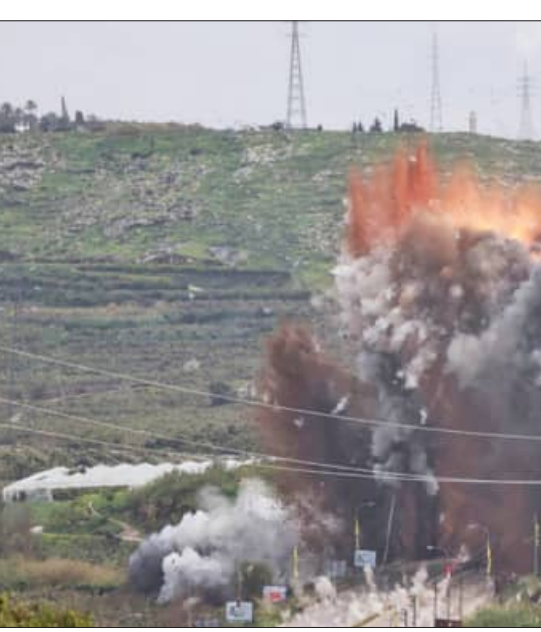
ମଧ୍ୟପ୍ରାଚ୍ୟ ଯୁଦ୍ଧର ୩୦ତମ ଦିନରେ ଇସ୍ରାଏଲ ଓ ଇରାନରେ ଆକ୍ରମଣ