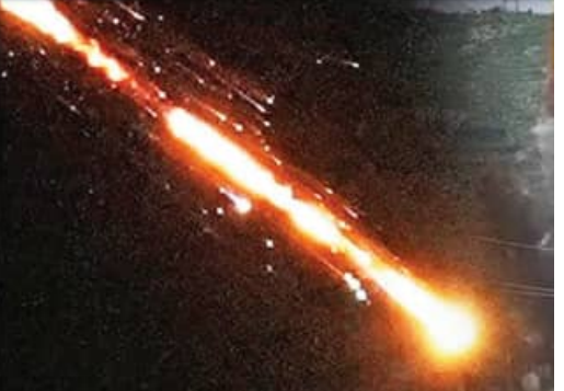
■ ତେଲ୍ ଆଭିଭ୍ ସମେତ ଅନେକ ସହର କ୍ଷତିଗ୍ରସ୍ତ ■ ଇସ୍ରାଏଲର ମଧ୍ୟ ପ୍ରଦେଶ ପ୍ରତି ଆକ୍ରମଣ