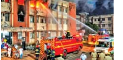
ହସ୍ପିଟାଲରେ ଅଗ୍ନି ନିରାପତ୍ତାର ହେବ ନିୟମିତ ଯାଞ୍ଚ

■ ଭୁବନେଶ୍ୱର, ୨୨ ମାର୍ଚ୍ଚ (ସମ୍ପାଦକ): ଏସ୍‌ସି‌ସି ଅଗ୍ନିକାଣ୍ଡ ଯୋଗୁଁ ୧୩ ଜଣ ରୋଗୀଙ୍କ ମୃତ୍ୟୁ ଘଟଣା ସାରା ରାଜ୍ୟରେ ଆଲୋଚନା ସୃଷ୍ଟି କରିଛି। ବିଜେଡି ଓ କଂଗ୍ରେସ ସ୍ୱାସ୍ଥ୍ୟମନ୍ତ୍ରୀଙ୍କ ଇସ୍ତଫା ଦାବିରେ ଅଡ଼ି ବସିଛନ୍ତି। ଏସ୍‌ସି‌ସି ନିଆଁ ଚାରିଦିନ ବିଧାନସଭା ବି ଗରମ ହୋଇଛି। ଗଲା ୩ ଦିନ