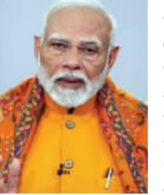
୨୦୦୧ରୁ ୨୦୧୪ ଗୁଜରାଟ ମୁଖ୍ୟମନ୍ତ୍ରୀ ୨୦୧୪ରୁ କୁମ୍ଭାରତ ତିନିଥର ପ୍ରଧାନମନ୍ତ୍ରୀ

■ ନୂଆଦିଲ୍ଲୀ, ୨୨ ମାର୍ଚ୍ଚ (ଏକେଡ୍): ପ୍ରଧାନମନ୍ତ୍ରୀ ନରେନ୍ଦ୍ର ମୋଦୀ ଭାରତୀୟ ରାଜନୀତିରେ ରବିବାର ଆଇ-ଏକ ମାଲକ୍ଷୁଷ୍ ଅତିକ୍ରମ କରି ଇତିହାସ ସୃଷ୍ଟି କରିଛନ୍ତି। ସେ ସରକାରୀ ମୁଖ୍ୟ ଭାବେ ୮,୯୩୧ ଦିନ ପୂରଣ କରି ଭାରତର ଦୀର୍ଘତମ ସମୟର ଶାସନକର୍ତ୍ତା ହେବାର ଗୌରବ ଅର୍ଜନ କରିଛନ୍ତି। ଏହି କ୍ରମରେ ସେ ସିକିମର ପୂର୍ବତନ ମୁଖ୍ୟମନ୍ତ୍ରୀ ପବନ କୁମାର ଗାମ୍ଲିଙ୍କ ୮,୯୩୦ ଦିନର ରେକର୍ଡକୁ ଅତିକ୍ରମ କରିଛନ୍ତି। ମୋଦୀଙ୍କ ଏହି ବଡ଼ ସଫଳତା ପଛରେ ରହିଛି ଦୁଇ ଦଶନ୍ଧିରୁ ଅଧିକ ସମୟର ନିରନ୍ତର ସେବା। ସେ ଗୁଜରାଟର ମୁଖ୍ୟମନ୍ତ୍ରୀ ଓ ଭାରତର ପ୍ରଧାନମନ୍ତ୍ରୀ ଭାବେ