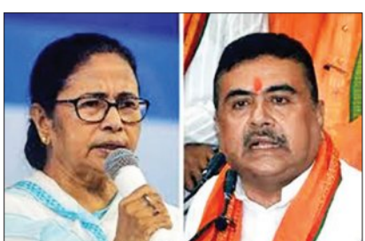
ଗତ ଥର ନବମ୍ବରରେ ହାରିଥିଲେ ମୁଖ୍ୟମନ୍ତ୍ରୀ ଶୁଭେନ୍ଦୁ ଅଧିକାରୀଙ୍କୁ ବିରୋଧରେ ଲଢ଼ିବାରୁ ମମତା ବାନାର୍ଜୀ ନିଷ୍ପତ୍ତି ନେଇଛନ୍ତି । ମମତା ଭବାନୀପୁରକୁ ଲଢ଼ିବେ । ସାମ୍ବାଦିକ ସମ୍ମିଳନୀରେ ମମତା କହିଥିଲେ ଯେ ବିଜେପି କାହିଁକି ଚାହୁଁଛନ୍ତି? ଯଦି ଲଢ଼ିବୁ ତେବେ ଗଣ୍ୟ ସମକର୍ତ୍ତ୍ୱ ସୃଷ୍ଟି କରାଯାଏ । ମୋକାଶ ଓହ୍ଲାଇ ସଠିକ ଭାବେ ମୁକାବିଲା କରା ଯାଏ । ଏହି ବିଧାନସଭା ନିର୍ବାଚନ ରାଜ୍ୟ ଅସ୍ତିତ୍ୱ ଲଢ଼େଇ । ଏଥିରେ ପଶ୍ଚିମବଙ୍ଗ ହିଁ କିଛି । ଦିଲ୍ଲୀର ଲଢ଼ି ପରାଜିତ ହେବ । ତଳିତ ପରଦିଏମସି ସେଲିବ୍ରିଟିବିଶେଷ ପ୍ରଧାନମନ୍ତ୍ରୀ ଦେଲନାହିଁ । ତୁଣ୍ଡକୁ ସୁରକ୍ଷିତ ନେତା ଏବଂ କର୍ମାଳ ଉପରେ ଦକ ଉପସ୍ଥାପନ କରିଛି । ୨୦୨୧ରେ ଟିଏମସି ୧୫ ସେଲିବ୍ରିଟିବିଶେଷ ଦେଇଥିଲା । ମାତ୍ର ଚଳିତ ଥର କେବଳ ୨ ଜଣଙ୍କୁ ଟିଏମସି ମିଳିଛି । ସେହିପରି ୪୨ ମହିଳାଙ୍କୁ ପ୍ରାର୍ଥୀ

କୋଲକାତା, ୧୭।୩।(ଏକେନ୍ଦ୍ରି): ନିର୍ବାଚନ କମିଶନ (ଇସି)ଙ୍କ ତାରିଖ ଘୋଷଣା ପରେ ପଶ୍ଚିମବଙ୍ଗରେ ବିଧାନସଭା ନିର୍ବାଚନ ପାଇଁ ଲଢ଼େଇ ଆରମ୍ଭ ହୋଇଯାଇଛି । ବିରୋଧୀ ବିଜେପି ପ୍ରଥମ ପ୍ରାର୍ଥୀ ତାରିକା ହାଜି କରିବାର ଦିନକ ପରେ ଶାସକ ଟିଏମସି ମଧ୍ୟ ସମାନ ପଦକ୍ଷେପ ଗ୍ରହଣ କରିଛି । ମୋଟ ୨୯୪ ଆସନରୁ ୨୯୧ଟି ପାଇଁ ପ୍ରାର୍ଥୀଙ୍କ ନାମ ଘୋଷଣା କରିଛି । ଅନ୍ୟ ତିନୋଟି ଆସନ ସହଯୋଗୀ ବିଜେପିଏମ ପାଇଁ ଟିଏମସି ଛାଡ଼ି ଦେଇଛି । ଗତ ବିଧାନସଭା ନିର୍ବାଚନ ପରି ଚଳିତ ଥର ମଧ୍ୟ ଦୁଇ ପୂର୍ବତନ ସହଯୋଗୀଙ୍କ ମଧ୍ୟରେ କଡ଼ା ମୁକାବିଲା ଦେଖିବାକୁ ମିଳିବ । ନିଜର ପୂର୍ବତନ ସହଯୋଗୀ ତଥା ବିଜେପି ନେତା ଶୁଭେନ୍ଦୁ ଅଧିକାରୀଙ୍କ ବିରୋଧରେ ଲଢ଼ିବାକୁ ମୁଖ୍ୟମନ୍ତ୍ରୀ ମମତା ବାନାର୍ଜୀ ନିଷ୍ପତ୍ତି ନେଇଛନ୍ତି । ମମତା ଭବାନୀପୁରକୁ ଲଢ଼ିବେ । ସାମ୍ବାଦିକ ସମ୍ମିଳନୀରେ ମମତା କହିଥିଲେ ଯେ ବିଜେପି କାହିଁକି ଚାହୁଁଛନ୍ତି? ଯଦି ଲଢ଼ିବୁ ତେବେ ଗଣ୍ୟ ସମକର୍ତ୍ତ୍ୱ ସୃଷ୍ଟି କରାଯାଏ । ମୋକାଶ ଓହ୍ଲାଇ ସଠିକ ଭାବେ ମୁକାବିଲା କରା ଯାଏ । ଏହି ବିଧାନସଭା ନିର୍ବାଚନ ରାଜ୍ୟ ଅସ୍ତିତ୍ୱ ଲଢ଼େଇ । ଏଥିରେ ପଶ୍ଚିମବଙ୍ଗ ହିଁ କିଛି । ଦିଲ୍ଲୀର ଲଢ଼ି ପରାଜିତ ହେବ । ତଳିତ ପରଦିଏମସି ସେଲିବ୍ରିଟିବିଶେଷ ପ୍ରଧାନମନ୍ତ୍ରୀ ଦେଲନାହିଁ । ତୁଣ୍ଡକୁ ସୁରକ୍ଷିତ ନେତା ଏବଂ କର୍ମାଳ ଉପରେ ଦକ ଉପସ୍ଥାପନ କରିଛି । ୨୦୨୧ରେ ଟିଏମସି ୧୫ ସେଲିବ୍ରିଟିବିଶେଷ ଦେଇଥିଲା । ମାତ୍ର ଚଳିତ ଥର କେବଳ ୨ ଜଣଙ୍କୁ ଟିଏମସି ମିଳିଛି । ସେହିପରି ୪୨ ମହିଳାଙ୍କୁ ପ୍ରାର୍ଥୀ