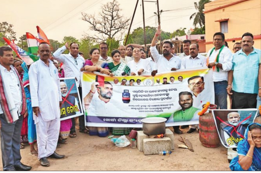
ସରକାର ସମୟରେ ୨୦୧୪ ମସିହା ସୁଦ୍ଧା ସିଲିଣ୍ଡର ପିଛା ୪୫୦ଟଙ୍କା ଥିଲା। ଏବେ ସିଲିଣ୍ଡର ପିଛା ୧୦୦୦ଟଙ୍କା ହୋଇଛି। ଏବେ ରକ୍ଷନଗ୍ୟାସ୍ ଦରବୃଦ୍ଧି ଆରମ୍ଭ ହୋଇଗଲାଣି। ସିଲିଣ୍ଡର ପିଛା ୨୦୦୦-୨୫୦୦ଟଙ୍କାରେ କିଣିବା ପାଇଁ ଲୋକେ ବାଧ୍ୟ ହେଉଛନ୍ତି। ଅନ୍ୟପକ୍ଷରେ ପ୍ରଧାନମନ୍ତ୍ରୀ ମୋଦି ଅପଥ୍ୟ