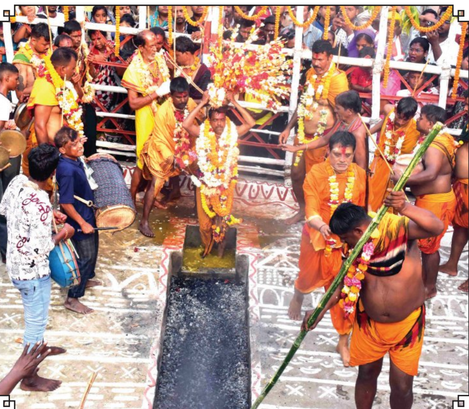
ଚୈତ୍ର ମାସରେ ମା' ଝାଡ଼େଶ୍ୱରୀଙ୍କ ପାଠରେ ଝାମୁଯାତ୍ରା