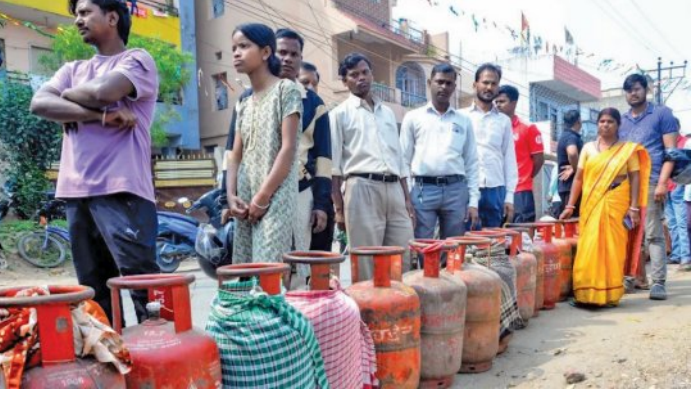
ଲାଗିଲା ଅତ୍ୟାବଶ୍ୟକ ସାମଗ୍ରୀ ଆଇନ ଅନେକ ରାଜ୍ୟରେ ବାଣିଜ୍ୟିକ ଗ୍ୟାସ୍ ଯୋଗାଣ ବନ୍ଦ

ନୂଆଦିଲ୍ଲୀ, ୧୦ମାର୍ଚ୍ଚ (ଏଜେନ୍ଟି): ଲଗାତାର ଯୁଦ୍ଧରେ ଭାରତରେ ରକ୍ଷଣ ଗ୍ୟାସ୍ ଯୋଗାଣ କ୍ଷେତ୍ରରେ ବଡ଼ ସଙ୍କଟ ସୃଷ୍ଟି ହୋଇଛି। ଦେଶର ଅଧିକାଂଶ ଭାଗରେ ଏଲ୍ପିଜି ସିଲିଣ୍ଡରର ଅଭାବ ଦେଖାଦେଇଛି। ସୋମବାର ସରକାର ଏଲ୍ପିଜି ରକ୍ଷଣ ଗ୍ୟାସ୍ ବୁକିଂ ନିୟମରେ ପରିବର୍ତ୍ତନ ପୂର୍ବକ ବୁକିଂ ଅବଧି ୨୧ ଦିନରୁ ୨୫ ଦିନକୁ ବୃଦ୍ଧି କରିବା ପରେ ସାରା ଦେଶରେ ଏଲ୍ପିଜି ସିଲିଣ୍ଡର ଉପଲବ୍ଧତାକୁ ନେଇ ଭାବେଣି ପଡିଯାଇଛି। ଓଡ଼ିଶାରେ ବି ଖାରବେଳ ମଧ୍ୟରେ ରକ୍ଷଣ ଗ୍ୟାସ୍ ସଙ୍କଟ କୋରଦାର ଅନୁଭୂତ ହୋଇଛି। ରାଜଧାନୀ ଭୁବନେଶ୍ୱରଠାରୁ ଆରମ୍ଭ କରି କଟକ, ବ୍ରହ୍ମପୁର, ଜୟପୁର, ସମ୍ବଲପୁର, ରାଉରକେଲା, ଯାଜପୁର ଏବଂ ବାଲେଶ୍ୱର ଭଳି ପ୍ରମୁଖ ସହରଗୁଡ଼ିକରେ ରକ୍ଷଣ ଗ୍ୟାସ୍ ଅଭାବ ନେଇ ଲୋକଙ୍କ ମଧ୍ୟରେ ଖବର କୋରସୋର ପ୍ରସାରିତ ହୋଇଯାଇଅଛି। ଏମିତିକି ମଙ୍ଗଳବାର ସକାଳୁ ସକାଳୁ ଗ୍ୟାସ୍ ଏଜେନ୍ଟିଗୁଡ଼ିକ ଆଗରେ ଗ୍ରାହକଙ୍କ ଲମ୍ବା ଲାଇନ୍ ଦେଖିବାକୁ ମିଳିଛି। ଗ୍ୟାସ୍ ଅଭାବକୁ ନେଇ ଦିଲ୍ଲୀ, ମଧ୍ୟପ୍ରଦେଶ, ମହାରାଷ୍ଟ୍ର, ଉତ୍ତର ପ୍ରଦେଶ, ରାଜସ୍ଥାନ ଏବଂ ଛତିଶଗଡ଼ ସମେତ ଅନେକ ରାଜ୍ୟ ଅଧିକାଂଶ ଭାବରେ ବାଣିଜ୍ୟିକ