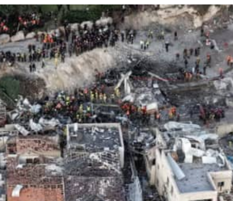
ଭୟଙ୍କର ଆକ୍ରମଣ ଅଭିଯାନ ଆରମ୍ଭ କରିବୁ: ଇରାନ ମୁକ୍ତପୋଡ଼ 'ଆବାହାମ୍ ଲିକନ୍' ଉପରେ କ୍ଷେପଣାସ୍ତ୍ର ମାଡ଼ ଇରାନ ଉପରେ ଆକ୍ରମଣକୁ ଚୀନ, ରଷ୍ଟ୍ର, ଉ.କୋରିଆର ନିନ୍ଦା ଅନ୍ତରାଷ୍ଟ୍ରୀୟ ସମ୍ପର୍କକୁ ନଷ୍ଟ କରିଛି ଆମେରିକା: ଚୀନ ଖାମନେଇଙ୍କ ହତ୍ୟା ବିରୋଧରେ ବିଭିନ୍ନ ଦେଶରେ ବିକ୍ଷୋଭ