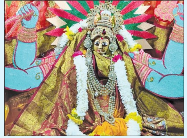
ବାରପଦା ମା'ଅମ୍ବିକାଙ୍କ ମାତଙ୍ଗା ବେଶ