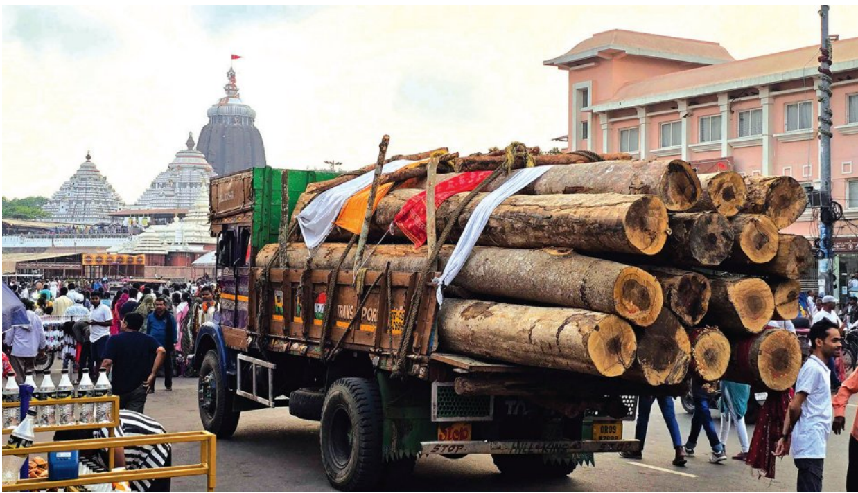
ପୁରୀ ବନ୍ଦୁଗଣରେ ବୌଦ୍ଧ ଆସିଥିବା ରଥକାଠ