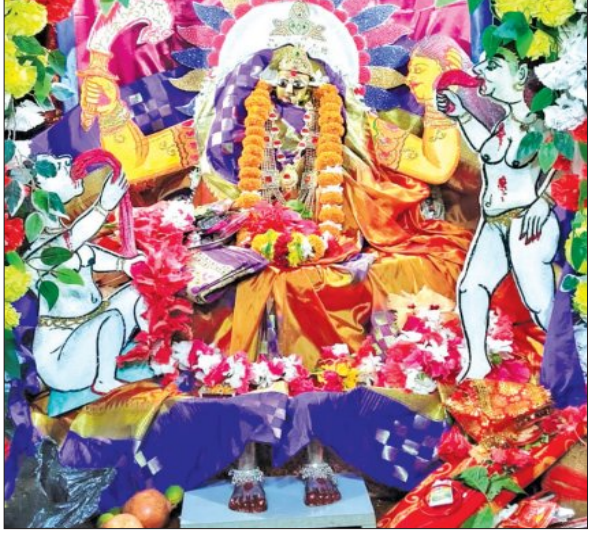
ବାରପଦା ମା' ଅମ୍ବିକାଙ୍କ ଛିନ୍ନମୟା ବେଶ