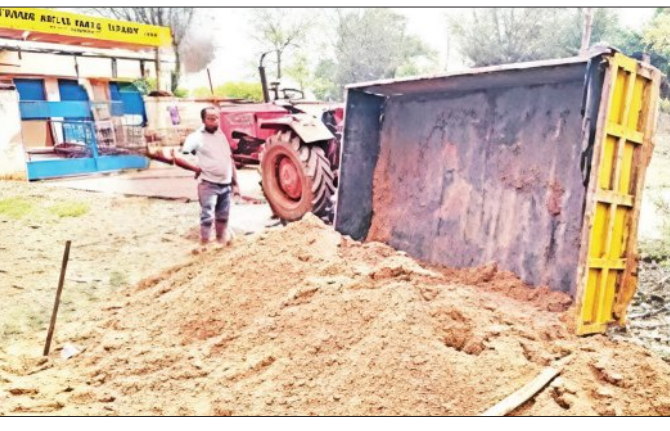
ବନ୍ଧୁ ମାରିଥିଲେ। ପୁଲିସ୍ ଘଟଣାସ୍ଥଳରେ ପହଞ୍ଚିବା ପୂର୍ବରୁ ଟ୍ରାକ୍ଟର ଅଞ୍ଚଳୀନ ହୋଇଯାଇଥିବା ବେତନଟୀ ଥାନା

ଲୋକଙ୍କ ଅସନ୍ତୋଷ ବଢ଼ୁଛି। ବିଭିନ୍ନ ଛକରେ ବାଲିମାଫିଆ ଲୋକ ଜରି ରହୁଥିବାରୁ ସାଧାରଣ ଲୋକ ଉଦ୍ଧାର ଅଞ୍ଚଳ ଗୁରୁବାର ଅପରାହ୍ଣରେ ପୁରୁଣାପାଣିର ତାରାକୋଟୀ ଆଖିପାଖିରେ ପୁଲିସ୍ ଟିମ୍ ପହଞ୍ଚିବା ପୂର୍ବରୁ ଦୁର୍ଘଟଣାଗ୍ରସ୍ତ ଟ୍ରାକ୍ଟର ଉଠାଇ ଫେରାର ହୋଇଥିବା ବାଲି ଚୋରଙ୍କୁ ଗ୍ରାମବାସୀଙ୍କୁ ତରଫଦାରୀରେ ପହଞ୍ଚିବାକୁ ଦେଖିବାକୁ ମିଳିଛି।