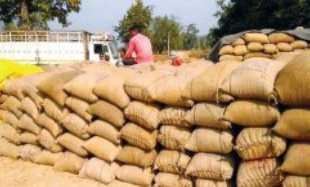
କଣ୍ଠ ପୂରିବାକୁ ଆଉ ୧୦ ଦିନ

■ ଭୁବନେଶ୍ୱର, ୨୦ମାର୍ଚ୍ଚ (ସମିତ): ଖରିଦ୍ ରତ୍ନରେ ୨୩ ଲକ୍ଷ ଟନ୍ ଧାନ ବିକିବାକୁ ସରକାର ଲକ୍ଷ୍ୟ ଧାର୍ଯ୍ୟ କରିଥିଲେ। ବର୍ତ୍ତମାନ ପର୍ଯ୍ୟନ୍ତ ୨୧ ଲକ୍ଷ ମେଟ୍ରିକ ଟନ୍ ଧାନ ବିକାଯାଇଥିବା ସରକାର ଦାବି କରୁଛନ୍ତି ଓ ଅବଶିଷ୍ଟ ୧୦ ଦିନରେ ଏହି ୨ ଲକ୍ଷ ଧାନ ବିକା ସରିବ। ମାତ୍ର ଏହା ପରେ ବିକ୍ରି ପାଇଁ ମଣ୍ଡିରେ ୩୦ ଲକ୍ଷ ଟନ୍ ଧାନ ଧରି ବସିଥିବା ୩ ଲକ୍ଷ ଚାଷୀ କ'ଣ କରିବେ, ତାହା ସବୁଠାରୁ ବଡ଼ ପ୍ରଶ୍ନ। ଟାଉଣସ୍ ଧାନ ହେଲେ ମଧ୍ୟ ସରକାର ଚାଷୀଙ୍କ ସହ ଧାନ ବିକିବାକୁ ଘୋଷଣା କରିଥିଲେ, ମାତ୍ର ଏବେ ଏହି ଧାନ ନ ବିକିବାକୁ କୁଆଡ଼େ ଭିଡିଗିଆ ନିର୍ଦ୍ଦେଶ ଦିଆଯାଇଛି। ଚାଷୀମାନେ ଧାନ ଧରି ମଣ୍ଡି ଆଗରେ ବସିଥିଲେ ବି ରାଜ୍ୟ ସରକାର