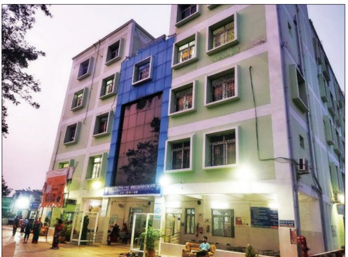
ରାଇରଙ୍ଗପୁର ଉପଖଣ୍ଡ ହସ୍ପିଟାଲ ଏକ ଗୁରୁତ୍ୱପୂର୍ଣ୍ଣ ହସ୍ପିଟାଲ । ଯେଉଁଠି କି ଅନେକ ରୋଗୀ ଚିକିତ୍ସା ନିମନ୍ତେ ନିର୍ଦ୍ଧାରଣ । ତେବେ ଚିକିତ୍ସିତ ହେବାକୁ ଆସୁଥିବା ରୋଗୀ, ତାଙ୍କ ସମ୍ପର୍କୀୟ, ଡାକ୍ତର ଓ କର୍ମଚାରୀଙ୍କ ସୁରକ୍ଷା ନେଇ ପ୍ରଶ୍ନବାଚୀ ସୃଷ୍ଟି କରିଛି । ହସ୍ପିଟାଲ ପରିସରରେ ଥିବା କୋଠାମାନଙ୍କରେ ଅଗ୍ନି ନିରାପତ୍ତା ଉପକରଣ ସହ ଅଗ୍ନି ନିରାପତ୍ତା ସିଲିଣ୍ଡର ମଧ୍ୟ ଲାଗିଥିବା ଅଗ୍ନି ନିରାପତ୍ତା ଉପକରଣ କାମ କରୁଛି କି ନାହିଁ ପ୍ରତି ୬ ମାସରେ ଥରେ ଅଗ୍ନିଶମ ବାହିନୀ ଯାଞ୍ଚ କରିବାର ନିୟମ ରହିଛି । ଏହାସହିତ ଉପକରଣ ବ୍ୟବହାର ନେଇ

ରାଇରଙ୍ଗପୁର, ୧୮।୩।(ସମ୍ପାଦକ): ରାଜ୍ୟର ପ୍ରମୁଖ ସରକାରୀ ହସ୍ପିଟାଲ କଟକସ୍ଥିତ ଏସ୍‌ସିଏ ମେଡିକାଲ କଲେଜରେ ଅଗ୍ନିକାଣ୍ଡ ଘଟି ୧୩ଜଣଙ୍କ ଜୀବନ ଯାଇଛି । ଯାହାକୁ ନେଇ ରାଜ୍ୟର ଅନ୍ୟ ହସ୍ପିଟାଲରେ ଅଗ୍ନି ନିରାପତ୍ତା ନେଇ ପ୍ରଶ୍ନବାଚୀ ସୃଷ୍ଟି ହୋଇଛି । ବିଶେଷକରି କିଛି ରାଇରଙ୍ଗପୁର ଉପଖଣ୍ଡ ହସ୍ପିଟାଲରେ କିପରି ଅଗ୍ନି ନିରାପତ୍ତା ବ୍ୟବସ୍ଥା ରହିଛି, ତାହା ମନରେ ପ୍ରଶ୍ନ ସୃଷ୍ଟି କରିଛି । ହସ୍ପିଟାଲରେ ଅଗ୍ନି ନିରାପତ୍ତା ବ୍ୟବସ୍ଥା ଥିବାବେଳେ ତାହାର ସ୍ଥିତି ନିୟମିତ ଭାବେ ଯାଞ୍ଚ ହେଉନାହିଁ । ନିରାପତ୍ତା ଉପକରଣଗୁଡ଼ିକରେ ବହଳ ଉଚ୍ଚର ଧୂଳି ବସିଗଲାଣି ।