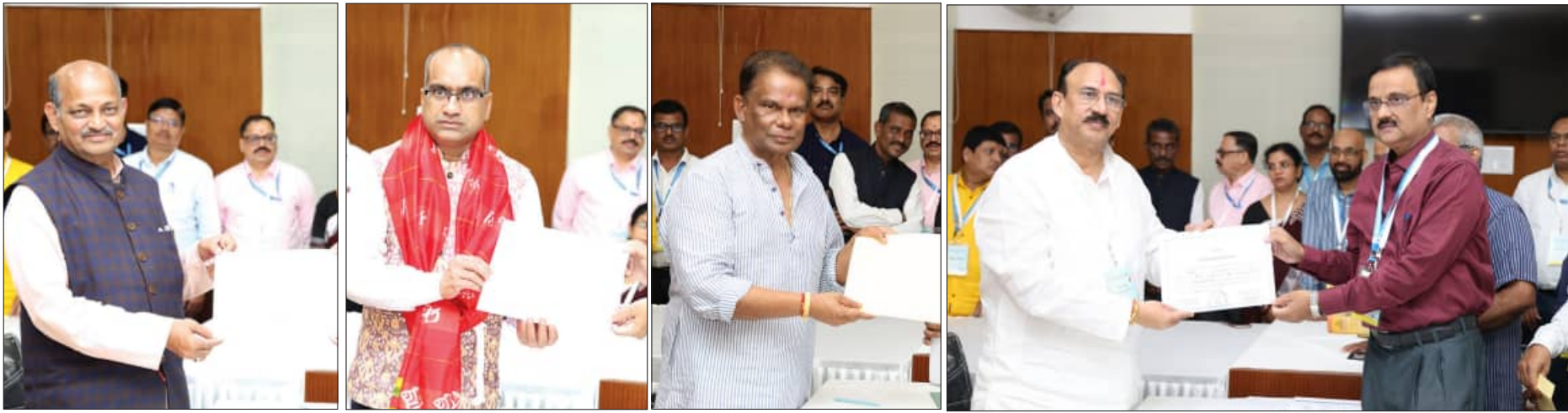
ନବନିର୍ବାଚିତ ରାଜ୍ୟସଭା ସଦସ୍ୟମାନେ ରିଟର୍ଣ୍ଣ ଅଫିସରଙ୍କଠାରୁ ନିର୍ବାଚିତ ହେବାର ପ୍ରମାଣପତ୍ର ଗ୍ରହଣ କରୁଛନ୍ତି