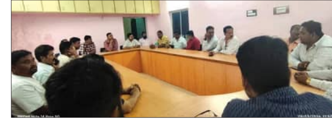
ଠିକାଦାର ଫାଏ ଓ ଛୁଦ୍ର ଜଳସେଚନ ବିଭାଗ ଆଲୋଚନା

ଜଣେ ନିର୍ଦ୍ଦେଶ ଠିକାଦାରଙ୍କୁ ଅନୁକମ୍ପା ଓ ଟେଣ୍ଡର ପ୍ରକ୍ରିୟାରେ ଅନିୟମିତତାକୁ ନେଇ ଚଳିତ ମାସରେ ରାୟଗଡ଼ା ଠିକାଦାର ଫାଏ ପକ୍ଷରୁ ଛୁଦ୍ର ଜଳସେଚନ ବିଭାଗ ଆକ୍ସଣ ଯନ୍ତ୍ରୀଙ୍କ ରାୟଗଡ଼ା କାର୍ଯ୍ୟାଳୟ ଘେରାଇ ସହ ରାୟଗଡ଼ା ଆନରେ ଏ ନେଇ ଏତଲା ଦିଆଯାଇଥିଲା। ଫଳରେ ଠିକାଦାର ଫାଏ ଓ ବିଭାଗୀୟ କର୍ତ୍ତୃପକ୍ଷଙ୍କ ମଧ୍ୟରେ ଏକ ବିବାଦୀୟ ପରିସ୍ଥିତି ସୃଷ୍ଟି ହୋଇଥିଲା। ତେବେ କିଛି ଦିନର ବ୍ୟବଧାନ ପରେ ଆକ୍ସଣ ଯନ୍ତ୍ରୀଙ୍କ ସହ ଠିକାଦାର ଫାଏ