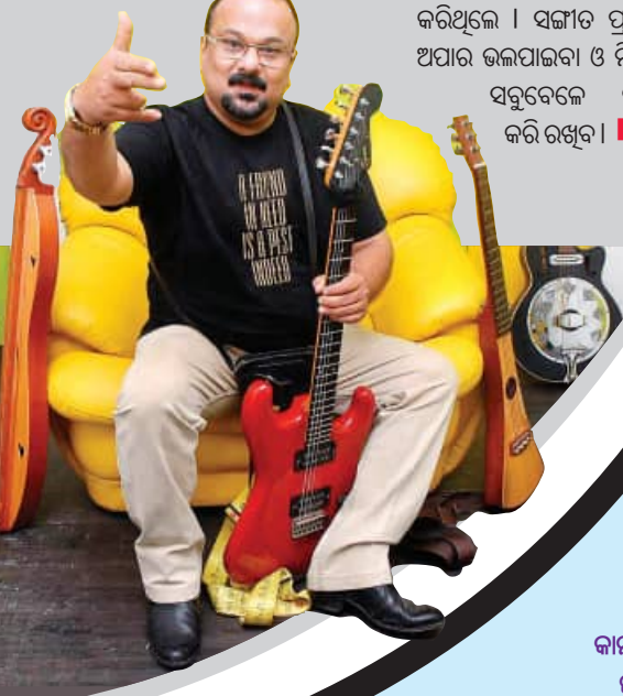
ବଡ଼ ପରଦାରେ କାମ କରିବାକୁ ଲାଗି ଅଛି?