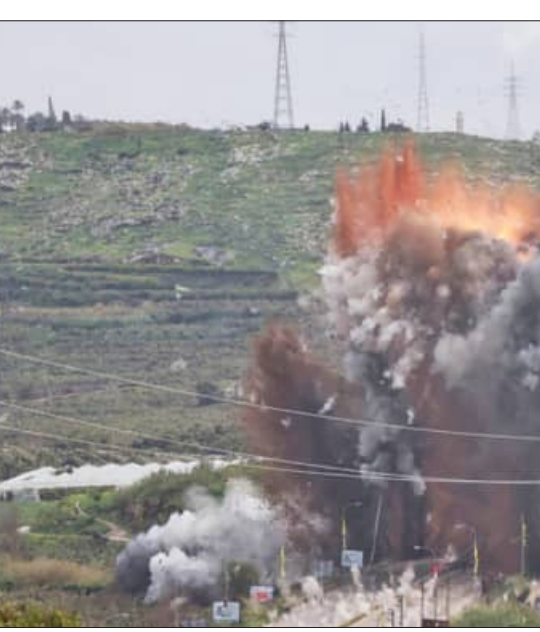
ମଧ୍ୟପ୍ରାଚ୍ୟ ଯୁଦ୍ଧର ୩୦ତମ ଦିନରେ ଇସ୍ରାଏଲ ଓ ଭରାନରେ ଆକ୍ରମଣ