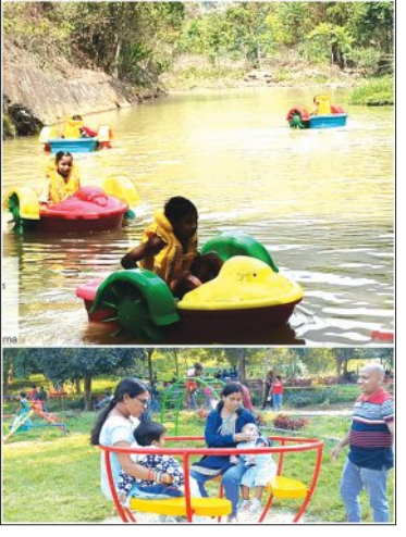
କନ୍ଧପୁର,୨୬ମାର୍ଚ୍ଚ(ସମିପ): ନୂଆ ରୂପରେ ରାଣା ଡୁଡୁମା। ଆଗକୁ ଗ୍ରୀଷ୍ମ ଛୁଟି ଆସୁଥିବା ବନ ବିଭାଗ ପକ୍ଷରୁ ନୂଆ ପ୍ରୟାସ କରାଯାଇଛି।