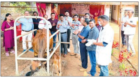
କୋରାପୁଟ,୨୬ମାର୍ଚ୍ଚ(ସମିପ): କୋରାପୁଟ ଜିଲ୍ଲାରେ ପଶୁ ସ୍ୱାସ୍ଥ୍ୟ ସୁରକ୍ଷାକୁ ଗୁରୁତ୍ୱ ଦେଇ ମିଶ୍ର ମୋଡ଼ରେ ପଶୁ ଟୀକାକରଣ କାର୍ଯ୍ୟକ୍ରମର ଶୁଭାରମ୍ଭ ହୋଇଯାଇଛି।