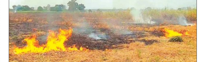
କୋଣାର୍କ,୨୬ମାର୍ଚ୍ଚ(ସମିପ): ନବରଙ୍ଗପୁର ଜିଲ୍ଲା କୋଣାର୍କପୁରୀ ବ୍ଲକ୍ ସନ୍ତୋଷପୁର ପଞ୍ଚାୟତର କଦକଟା ଗ୍ରାମରେ ପ୍ରାୟ ୪ରୁ ୫ ଏକର ଆଖୁ ବାଡ଼ି ନିଆଁରେ ଜଳିଯାଇଛି।