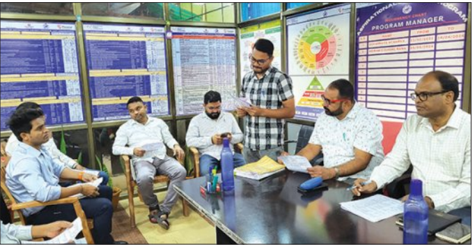
ନବରଙ୍ଗପୁର,୨୬ମାର୍ଚ୍ଚ(ସମିପ): ଆସନ୍ତା ଏପ୍ରିଲ ୧ ତାରିଖ ଓଡ଼ିଆ ଦିବସ ଠାରୁ ଏପ୍ରିଲ ୧୪ ତାରିଖ ପର୍ଯ୍ୟନ୍ତ ଏକାଡ଼େମି ଜିଲ୍ଲାରେ 'ଓଡ଼ିଆ ପକ୍ଷ-୨୦୨୬' ପାଳନ କରାଯିବ।

କାର୍ଯ୍ୟକ୍ରମ ସମ୍ପର୍କରେ ଆଲୋଚନା କରିବ ପାଳିତ ହେବ। ପକ୍ଷ ଶେଷ ଭାଗରେ ଏପ୍ରିଲ ୧୧ ଓ ୧୨ରେ ଓଡ଼ିଆ ସାହିତ୍ୟ ଏକାଡ଼େମି ଦ୍ୱାରା ଯୁବ ଲେଖକ ସମ୍ମିଳନୀ ଓ ବରପୁତ୍ରଙ୍କ ଉପରେ ଆଲୋଚନାଚକ୍ର ହେବ।