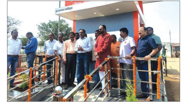
ସେମିନାରୀ,୨୬ମାର୍ଚ୍ଚ(ସମିପ): ହିଣ୍ଡାଲକୋ କମ୍ପାନୀ ପକ୍ଷରୁ ସ୍ଥାନୀୟ ଅଞ୍ଚଳ ପାରିପାତ୍ରିକ ବିକାଶ କାର୍ଯ୍ୟକ୍ରମ ଆଧୀନରେ କୋରାପୁଟ ଜିଲ୍ଲାର ସେମିନାରୀ ଗ୍ରାମରେ ଏକ ବୈଠକ ଯୋଜନା କରାଯାଇଛି।