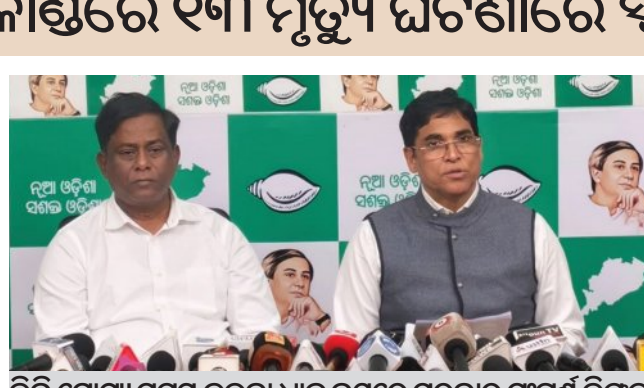
ବିକ୍ରି ଯୋଗ୍ୟ ସମସ୍ତ ବଳକା ଧାନ କ୍ରୟରେ ସରକାର ସଂପୂର୍ଣ୍ଣ ବିପଳ ନବୀନ ସରକାରଙ୍କ ପ୍ରକଳ୍ପର ରକ୍ଷଣାବେକ୍ଷଣରେ ସରକାର ଅକ୍ଷମ

ଭୁବନେଶ୍ୱର, ୨୦୩୩ (ସମିଧ): ରାଜ୍ୟରେ ଓଡ଼ିଆ ଅସ୍ମିତା ସରକାର ନୁହେଁ, ବରଂ ରାଜ୍ୟରେ ହାଇବ୍ରଡ୍ (ଶଙ୍କରଜାତୀୟ) ଗୁଜରାଟୀ ଓଡ଼ିଆ ଅସ୍ମିତା ସରକାର ଚାଲିଛି। ବିଧାନସଭାରେ ମୁଖ୍ୟମନ୍ତ୍ରୀ ଜଳସମ୍ପଦ ବିଭାଗର ଖଟିବାଦି ଆଲୋଚନାରେ ଅନୁପସ୍ଥିତ ବିରୋଧୀଙ୍କୁ ସମାଲୋଚନା କରୁଛନ୍ତି। ଏପରି ଦୁର୍ଭାଗ୍ୟଜନକ ଘଟଣା ଓଡ଼ିଶାରେ କେବେ ଦେଖାଯାଇ ନାହିଁ। ମୁଖ୍ୟମନ୍ତ୍ରୀ ଗୃହରେ ଅପ୍ରସଙ୍ଗିକ କଥା କହି ନିଜର ଓ ଗୃହର ମର୍ଯ୍ୟାଦାହୀନ କରିଛନ୍ତି ବୋଲି ସମାଲୋଚନା କରିଛନ୍ତି ବିଜେଡି।