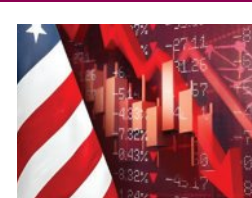
ମାସକରେ ବୁଡ଼ିଲାଣି ୨୮୨ ଲକ୍ଷ କୋଟି

■ ଖାଫିଂଟନ, ୨୧ମାର୍ଚ୍ଚ (ଏକେନ୍ଦ୍ରି): ଭାରତ ଆକ୍ରମଣ କରି ଆମେରିକା ରାଷ୍ଟ୍ରପତି ଡୋନାଲ୍ଡ ଟ୍ରମ୍ପ ପସି ଯାଇଛନ୍ତି। ଏହି ଯୁଦ୍ଧ ଟ୍ରମ୍ପଙ୍କୁ ବିଚଳିତ କରିଦେଇଛି। ବାରିପଦ୍ଧ ଯେଉଁ ହୋଇ ପଡ଼ିଥିବା ପୋଡ଼ୁସ ନିଜ ଦେଶର ଅର୍ଥିକ ସ୍ଥିତିକୁ ସମ୍ଭଳି ପାରୁନାହାନ୍ତି। ଲୋକପ୍ରିୟତା ହରାଇ ଚାଲିଥିବା ସତ୍ତ୍ୱେ ଟ୍ରମ୍ପ ଅନ୍ୟ ଦେଶକୁ ଧମକ ଦେଇ ଚାଲିଥିବାବେଳେ ଯୁଦ୍ଧ ପାଇଁ ଆମେରିକା ସେୟାର ବଜାର ଧରାଶାୟୀ ହୋଇଯାଇଛି। କୁମ୍ଭାଗତ ଚତୁର୍ଥ ସମ୍ବାହରେ ସେୟାର ବଜାରରେ ହ୍ରାସ ଦେଖା ଦେଇଛି। ଏସଏକ୍ସପି୫୦୦ ଇଣ୍ଡେକ୍ସ ଗତ ସମ୍ବାହରେ ୨.୫୦ ପ୍ରତିଶତରୁ ଅଧିକ ହ୍ରାସ ପାଇଛି। ଏହା ଦ୍ୱାରା ବଜାର ପୁଞ୍ଜି ୧ ଟ୍ରିଲିୟନ ଡଲାରରୁ ଅଧିକ ▶ପୃଷ୍ଠା-୭