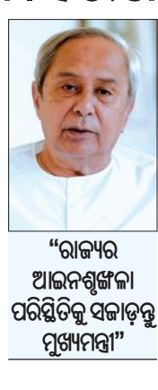
“ରାଜ୍ୟର ଆଇନଶୁଖିଲା ପରିସ୍ଥିତିକୁ ସକାଡ଼ିବୁ ମୁଖ୍ୟମନ୍ତ୍ରୀ”