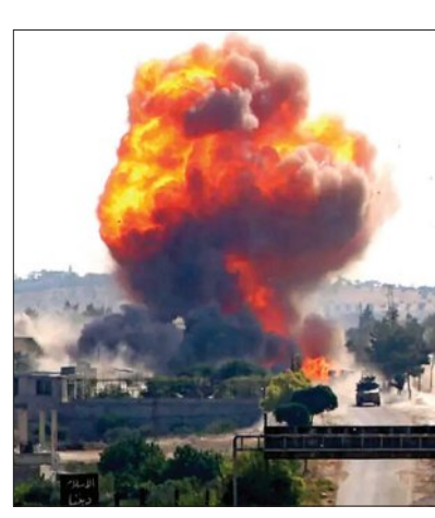
ଗୁପ୍ତ ସାମରିକ କ୍ଷମତା ନେଇ ବଢ଼ିଲା ଚିନ୍ତା ତିଏଗୋ ଗାସିଆ ଉପରେ ବିପଦ ଆକ୍ରମଣ ସତ୍ତ୍ୱେ ସହଯୋଗୀ ଦେଶଗୁଡ଼ିକୁ ବଡ଼ ବିପଦ ବୋଲି କହିଲା ବିଜେଡି

■ ନୂଆଦିଲ୍ଲୀ, ୨୧ମାର୍ଚ୍ଚ (ଏକେନ୍ଦ୍ରି): ଭାରତ ମହାସାଗରରେ ଅବସ୍ଥିତ ଆମେରିକା ଓ ବ୍ରିଟେନର ମିଳିତ ସାମରିକ ଘାଟି ତିଏଗୋ ଗାସିଆ ଉପରେ କଳା ଭରାନ ଦ୍ୱାରା ବାଲିଷ୍ଟିକ ମିସାଇଲ ନିକ୍ଷେପ କରାଯାଇଥିବା ଖବର ଏବେ ବିଶ୍ୱ ରାଜନୀତିରେ ହଜିତ ବୃଦ୍ଧି କରିଛି। ଏହି ଘଟଣା ଭାରତର ପ୍ରକୃତ ସାମରିକ ଶକ୍ତି, କ୍ଷମତା ଓ ଏହାର ପରିସରକୁ ନେଇ ଅନେକ ପ୍ରଶ୍ନବାଚୀ ସୃଷ୍ଟି କରିଛି। ଏହି ଘଟଣା ଏବେ ଯୁଦ୍ଧର ସୀମା ଓ ରାଜନୀତିକ ଭୂଗୋଳକୁ ଏକ ନୂଆ ମୋଡ଼ ଦେଇଛି। ଭାରତ ସାମରିକ ନାଭି ସାକ୍ଷୀ କରିଛି ଯେ, ତା'ର କ୍ଷେପଣାସ୍ତ୍ର ସୀମା ୨,୦୦୦ କିଲୋମିଟର ମଧ୍ୟରେ ସୀମିତ। କିନ୍ତୁ ତିଏଗୋ ଗାସିଆ ଭାରତରୁ ପ୍ରାୟ ୪,୦୦୦ କିମି ଦୂରରେ ଅବସ୍ଥିତ। ଯଦି ଭାରତ ଏହି ଦୂରତାକୁ ଲକ୍ଷ୍ୟ କରିବାକୁ ଚେଷ୍ଟା କରିଛି, ତେବେ ଏହାର ଅର୍ଥାତ୍ମହତ୍ତ୍ୱ ଭାରତ ପାଖରେ ଏମିତି କିଛି ଗୁପ୍ତ କ୍ଷମତା ଅଛି ଯାହା ବିଶ୍ୱରେ ବିଶ୍ୱ ଅବଗତ ନୁହେଁ। ଏହି ପ୍ରକାର ଦ୍ୱାରା ଭାରତ ଏବେ ପ୍ରମାଣ କରିବାକୁ ଚାହୁଁଛି ଯେ ଭାରତ ମହାସାଗର ଓ ଦକ୍ଷିଣ ଯୁଗ୍ମରେ ଅନେକ ଅଞ୍ଚଳ ଏବେ ତାହାର ଲକ୍ଷ୍ୟଭେଦ ପରିସର ମଧ୍ୟକୁ ଆସିଯାଇଛି। ପ୍ରକୃତପକ୍ଷେ ଭାରତ ▶ପୃଷ୍ଠା-୭