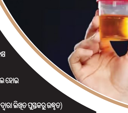
(ଲକ୍ଷଣ ମିଶ୍ରିତ ଦ୍ୱାରା ଲିଖିତ ପୃଷ୍ଠକରୁ ଉଦ୍ଧୃତ)