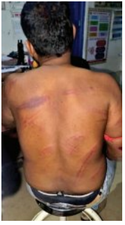
ଗାଡ଼ି ଓଭରଟେକ୍ କରିବାରୁ ମାଡ଼

■ ବାଲେଶ୍ୱର, ୨୬।୩ (ସମ୍ବାଦ): ବାଲେଶ୍ୱର ଜିଲ୍ଲା ନାଳଗିରି ଜୁଲୁହା ଫରେଷ୍ଟ ରେଞ୍ଜରେ ବନବିଭାଗର ଏସିଏଫ୍ ଜଣେ ଫରେଷ୍ଟ ଗାର୍ଡକୁ ନିର୍ମମ ଭାବେ ପିଟି ଲଢୁଲୁହାଣ କରିବା ଘଟଣା ଚାରୁ ଆଲୋଚନା ସୂଚ୍ୟ କରିଛି। ଗାଡ଼ି ଓଭରଟେକ୍ ଜଳି ସାଧାରଣ ଘଟଣାକୁ କେନ୍ଦ୍ର କରି ଏହି ଘଟଣା ଘଟିଥିବା କୁହାଯାଇଛି। ସଫୁଲ୍ ଫରେଷ୍ଟଗାଡ଼ ଫକାର ମୋହନ ମେଡ଼ିକାଲ କଲେଜ ଓ ହସପିଟାଲରେ ଭର୍ତ୍ତି କରାଯାଇଛି। ସେ ଏବେ ହସ୍ପିଟାଲ ଶଯ୍ୟାରେ ଗୁରୁତ୍ୱ ସହ ସଂରକ୍ଷ କରୁଛନ୍ତି। >ପୃଷ୍ଠା-୭