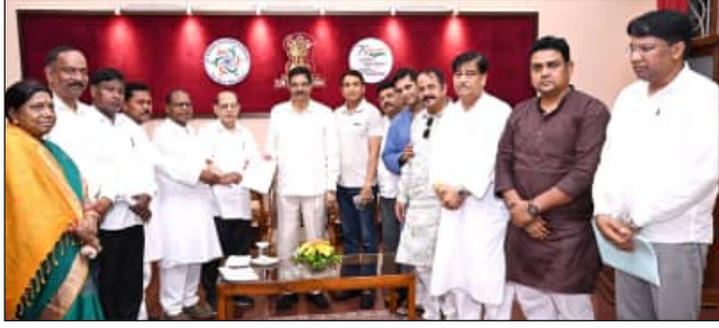
ରାଜ୍ୟପାଳଙ୍କ ନିକଟରେ ମିଳିତ ବିରୋଧୀ ଦଳ ପକ୍ଷରୁ ସ୍ୱାସ୍ଥ୍ୟମନ୍ତ୍ରୀଙ୍କ ଉପସ୍ଥାପନା ଦାବି