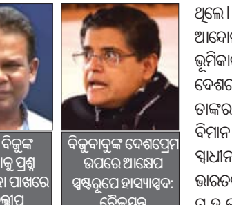
ଦେଶପ୍ରତି ବିଜୁଙ୍କ ପ୍ରତିବନ୍ଧକାଳୁ ପ୍ରଶ୍ନ ଅଧିକାର କାହା ପାଖରେ ନାହିଁ: ଦିଲ୍ଲୀପ

ଭୁବନେଶ୍ୱର, ୩୦/୩(ସମିଧ): ବିଜୁ ପଟ୍ଟନାୟକଙ୍କ ପ୍ରତି ଅପମାନସୂଚକ ମନ୍ତବ୍ୟ ନେଇ ରାଜ୍ୟବ୍ୟାପୀ ବିଭିନ୍ନ ମହଲରେ ତୀବ୍ର ଆନ୍ତୋଷ ଦେଖିବାକୁ ମିଳୁଛି। ବିଭିନ୍ନ ଦଳର ନେତୃତ୍ୱ ବିଜେପି ସାଂସଦ ନିଶିକାନ୍ତ ଦୁବେଙ୍କୁ କଡ଼ା ଉତ୍ତର ଦେଇଛନ୍ତି। ଏହିକ୍ରମରେ ସାମାଜିକ ଗଣମାଧ୍ୟମରେ ପ୍ରତିକ୍ରିୟା ରଖୁଛନ୍ତି ଏକଦା ବିଜୁ ବାବୁଙ୍କର ସହଯୋଗୀ ବୋଲାରଥିବା ରାଜ୍ୟସଭା ସାଂସଦ ଦିଲ୍ଲୀପ ରାୟ ଓ ଲୋକସଭା ସାଂସଦ ବିକ୍ରମଜିତ ପଣ୍ଡା। ଉଭୟ ସାମାଜିକ ଗଣମାଧ୍ୟମ ଏବଂ ବିଜୁବାବୁଙ୍କ ଗୁଣଗାନ କରି ପ୍ରବନ୍ଧ ଦେଖାଯାଇଛି, ଜାତୀୟ ଗୌରବ ବୋଲି ଉଲ୍ଲେଖ କରିଛନ୍ତି ଓ ଦୁଲେଇ ବେଳେ ନିଜ ଦଳର ସାଂସଦ ନିଶିକାନ୍ତ ଦୁବେଙ୍କୁ ଚୁକ୍ତି ଅପମାନୋଚନା କରିଛନ୍ତି ଉଭୟ ଦିଲ୍ଲୀପ ଓ ବିକ୍ରମଜିତ।