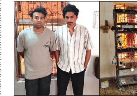
କେଉଁକେ ୨ ଯୁବକ ଗିରଫ ତାଜନା ହାର୍ଡ଼ୱେୟାର, ଆସାମ ସିମ୍

ଗୁପ୍ତ ଭାବେ ସିମ୍ ବକ୍ସ ଅପରେଟ୍ କରୁଥିଲେ । ଏହି ସିମ୍ ବକ୍ସରେ ତାଜନା ହାର୍ଡ଼ୱେୟାର ବ୍ୟବହାର କରାଯାଉଥିଲା । ଏହାସହ ବ୍ୟକ୍ତିଗତ ସମ୍ପୃକ୍ତ ଚନ୍ଦ୍ରଶେଖର ବ୍ୟବହାର କରାଯାଉଥିଲା । ଅଭିଯୁକ୍ତମାନେ ସିମ୍ ବକ୍ସରୁ ଆସାମରୁ ଆଣିଥିଲେ । ଏମାନେ ବହୁଦିନରୁ ଏହି ବେଆଇନ କାରବାରରେ ଥିଲା ବେଳେ ଗତକାଲି