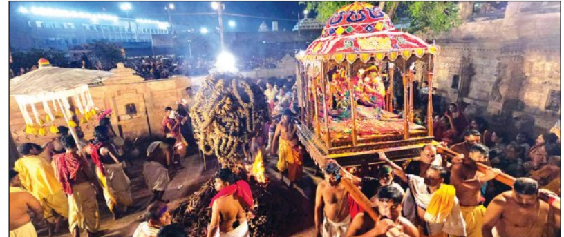
ଆଜି ମହାପ୍ରଭୁଙ୍କ ସୁନାବେଶ

ପୁରୀ, ୨୩ (ସମ୍ବିଧ): ପାଳଗୁରୁ ଶୁକ୍ଳ ଚତୁର୍ଦ୍ଦଶା ତିଥିରେ ସୋମବାର ମହାପ୍ରଭୁଙ୍କ ଅଗ୍ନି ଉତ୍ସବ ବା ମେଣ୍ଟାପୋଡ଼ି ନୀତି ସମ୍ପନ୍ନ ହୋଇଛି । ମଙ୍ଗଳବାର ପବିତ୍ର ଦୋଳପୂର୍ଣ୍ଣିମା। ଶ୍ରୀମନ୍ଦିର ଉତ୍ସବସମୟରେ ବିରାଜିତ ଚତୁର୍ଦ୍ଦଶା ବିଗ୍ରହଙ୍କ ଦୁର୍ଲଭ ସୁନାବେଶ ଅନୁଷ୍ଠିତହେବ । ଏଥିପାଇଁ ଶ୍ରୀମନ୍ଦିରରେ ରହେକାରଣକାର ଶ୍ରଦ୍ଧାଳୁଙ୍କ ସମାଗମ ହେବ । ଏହାକୁ ନଜରରେ ରଖି ପ୍ରଶାସନ ପକ୍ଷରୁ ସମସ୍ତ ପ୍ରକାର ବ୍ୟବସ୍ଥା କରାଯାଇଛି । ସୋମବାର ଶ୍ରୀମନ୍ଦିରରେ ଦ୍ୱିପ୍ରହର ଧୂପ ସରିବା ପରେ ତିନିବାଡ଼ରେ ମଇଲମ ହୋଇଥିଲା । ପାଳିଆ ମେଳାପ ଚଣ୍ଡାର ଘରୁ ଚନ୍ଦନ ବିଜେ କରାଇବା ପରେ ପୁଷ୍ପାଳକ ସେବକ ସର୍ବାଙ୍ଗ ଲାଗି କରାଯାଉଥିଲା । ଏହାପରେ ଚାଟେରା ବେଶ ନିମନ୍ତେ ଶ୍ରୀଦେବୀ, ଭୂଦେବୀ