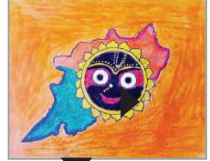
ଶୁଭଶ୍ରୀ ହାଁସବା ଚତୁର୍ଥ ଶ୍ରେଣୀ ସରକାରୀ ଉଚ୍ଚ ବିଦ୍ୟାଳୟ, ଅସପାଳ, ମୟୂରଭଞ୍ଜ