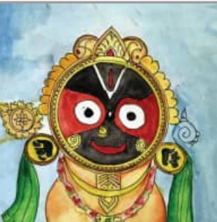
ଅଭିକାଶ ସାମ ଦଶମ ଶ୍ରେଣୀ ବଲାଙ୍ଗିର ପବ୍ଲିକ୍ ସ୍କୁଲ ବଲାଙ୍ଗିର