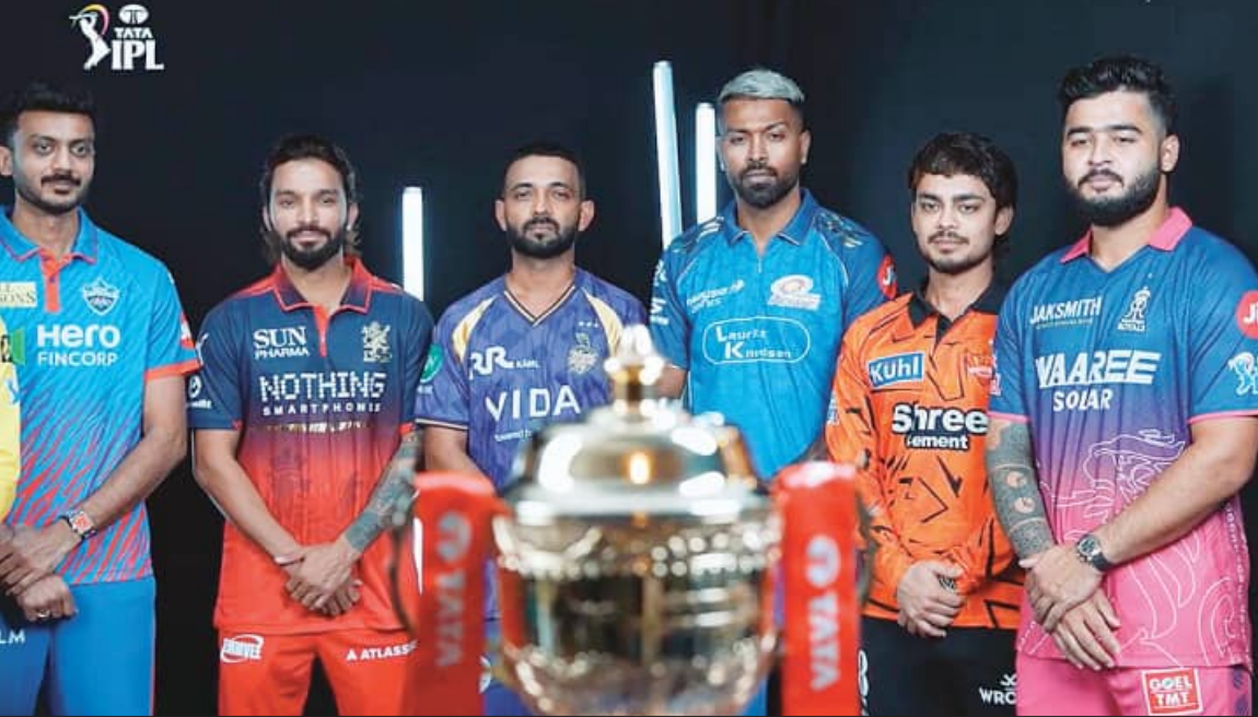
ବେଙ୍ଗାଲୁରୁ ୨୭ ମାର୍ଚ୍ଚ (ଏକେଡ୍)