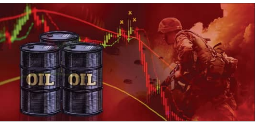
ବଢ଼ିଲା ଅଶୋଧିତ ଟୈଳ ଦର ଖୁବ୍ ଜୋରରେ ବହୁଛି ଅନିଷ୍ଠିତତା ପ୍ରଭାବିତ ହେବ ଭାରତ

ନୂଆଦିଲ୍ଲୀ, ୨୬ ମାର୍ଚ୍ଚ (ଏକେନ୍ସି): ସମ୍ପ୍ରତି ଟୈଳ ସଙ୍କଟରୁ ମୁକ୍ତିଲାଭ ପାଇଁ ବିଶ୍ୱ ସଂଘର୍ଷ କରୁଛି। ଇରାନ ଏବଂ ଆମେରିକା/ଇସ୍ରାଏଲ ମଧ୍ୟରେ ଯୁଦ୍ଧ ଅଧିକାର ସଙ୍କେତ ପରେ, ରୁଷ ଉପରେ ଯୁକ୍ରେନ୍ ଆକ୍ରମଣ ଏବେ ଚିନ୍ତାକୁ ଆହୁରି ବଢ଼ାଇଦେଇଛି। ଇରାନର ହର୍ମୁଜ ପ୍ରଶାନ୍ତା ଅବରୋଧ ମାର୍ଗରେ ଟୈଳ ପରିବହନକୁ ଗୁରୁତର ଭାବରେ ବାଧା ଦେଇଛି। ଫଳସ୍ୱରୂପ, ରୁଷର ତେଲ ଭାରତ ସମେତ ବିଶ୍ୱର ଶକ୍ତି ଆବଶ୍ୟକତା ପୂରଣ କରିଥିଲା। କିନ୍ତୁ ବର୍ତ୍ତମାନ, ରୁଷ ତେଲ ମଧ୍ୟ ଏକ ସଙ୍କଟର ସମ୍ମୁଖୀନ ହେଉଛି। ସର୍ବୋତ୍ତମ ଯୁକ୍ରେନ୍ ଆକ୍ରମଣ ରୁଷକୁ ବହୁତ କ୍ଷତି ପହଞ୍ଚାଇଛି। ଯୁକ୍ରେନ୍ ତରଫରୁ ଆକ୍ରମଣ ରୁଷର ଟୈଳ ପାଇପଲାଇନକୁ ଧୂସ୍ର କରିଦେଇଛି। ଏହି ଆକ୍ରମଣ ଯୋଗୁଁ ରୁଷର ଟୈଳ ରପ୍ତାନି କ୍ଷମତାର ଅତି କମରେ ୪୦% ବାଧାପ୍ରାପ୍ତ ହୋଇଛି। ରବର୍ଟସ୍ ରିପୋର୍ଟ ଅନୁଯାୟୀ, ଏହା ବିଶ୍ୱର ଦ୍ୱିତୀୟ ବୃହତ ଟୈଳ ରପ୍ତାନିକାରୀ ରୁଷ ପାଇଁ ଏକ ଗମ୍ଭୀର ସଙ୍କଟ।