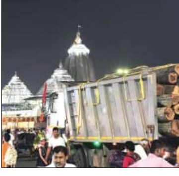
ନୟାଗଡ଼, ବୌଦ୍ଧ, ଖୋର୍ଦ୍ଧା ପୁରୀ ରଥଖଣ୍ଡରେ ପହଞ୍ଚିଲା ତୃତୀୟ ପର୍ଯ୍ୟାୟ ରଥକାଠ

ପୁରୀ, ୨୬ ମାର୍ଚ୍ଚ (ସମ୍ପାଦକ): ଘୋଷଯାତ୍ରା ପାଇଁ ଗୁରୁବାର ବୌଦ୍ଧ ମାଧ୍ୟମର ବନଖଣ୍ଡରୁ ତୃତୀୟ ପର୍ଯ୍ୟାୟ ରଥକାଠ ଆସି ପହଞ୍ଚିଛି । ଗୋଟିଏ ଟ୍ରକରେ ୨୮ ଖଣ୍ଡ ଅସନ କାଠ ପହଞ୍ଚିଥିବାବେଳେ ତତୁଧରୁ ୧୨ ପୁଟିଆ ୯ ଖଣ୍ଡ, ୨୦ ପୁଟିଆ ୧୯ ଖଣ୍ଡ କାଠ ରହିଛି । ଗ୍ରୀଷମଋତୁରେ ମହାପ୍ରଭୁଙ୍କ ଚିନି ରଥର କାଠ ଅନୁକୂଳ ପୂଜା ହୋଇ ସାରିଛି । ୩ଟି ୧୨ ପୁଟିଆ ଧଉଳା କାଠ ରଥକାଠ ଅନୁକୂଳ ପର୍ବରେ ପୂଜା କରାଯାଇଥିଲା । ଏବେ ଅକ୍ଷୟ ତୃତୀୟକୁ ଅପେକ୍ଷା କରାଯାଇଛି । ଏହି ଚିହ୍ନରେ ମହାପ୍ରଭୁଙ୍କ ଚିନି ରଥର ନିର୍ମାଣ ଅନୁକୂଳ ପର୍ବ ସମ୍ପନ୍ନ ହେବ । ତା' ପୂର୍ବରୁ ଚିନି ରଥ ପ୍ରାଥମିକ ପର୍ଯ୍ୟାୟରେ ଆବଶ୍ୟକ ରଥ କାଠ ୪ଟି ଜିଲ୍ଲା ଗଞ୍ଜାମ,