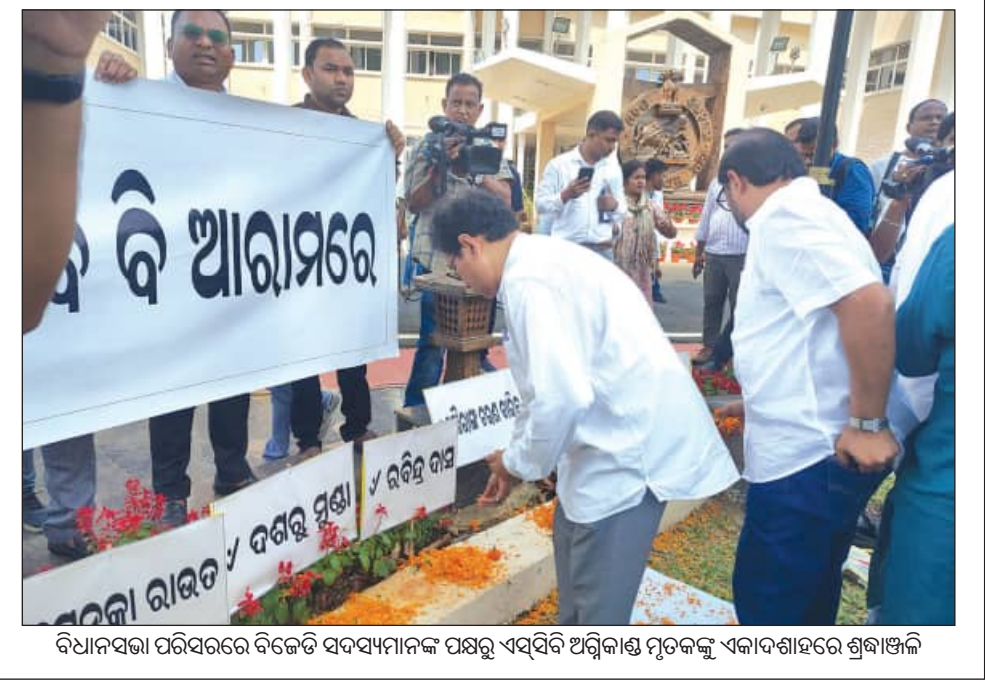
ବିଧାନସଭା ପରିସରରେ ବିଜେଡି ସଦସ୍ୟମାନଙ୍କ ପକ୍ଷରୁ ଏସସିବି ଅଗ୍ନିକାଣ୍ଡ ମୃତକଙ୍କୁ ଏକାଦଶାହରେ ଶ୍ରଦ୍ଧାଞ୍ଜଳି

ଓ ସେମାନଙ୍କ ସମ୍ପର୍କୀୟ ଚିକିତ୍ସା ସୂଚନା ଦେବା ପାଇଁ ରିଅଲ୍-ଟାଇମ୍ ଡିଜିଟାଲ୍ ଡିଭିସନ୍ ସ୍ଥାପନ କରିବାକୁ କୁହାଯାଇଛି । ଏହି କାର୍ଯ୍ୟର ଅଗ୍ରଗତି ନେଇ ମୋ' ଓଡ଼ିଶା ସୁଦ୍ଧା ଆପତ୍ତିତଭିତ୍ ଦାଖଲ କରିବାକୁ ସରକାରଙ୍କୁ କୁହାଯାଇଛି । ଅନ୍ୟପକ୍ଷରେ, ମେଡିକାଲ କେନ୍ଦ୍ରୀୟ ଉପକ୍ରମଣକରେ ସ୍ୱାସ୍ଥ୍ୟକର ପରିବେଶ ଏବଂ ସ୍ୱଚ୍ଛତା ବଜାୟ ରଖିବା ପାଇଁ ପ୍ରଶ୍ନାବଳୀ ପତ୍ରକୁ ଲୁହା କାଳି ଗେଟ୍ କରାଯାଇଥିବା ସୂଚନାକୁ କୋର୍ଟ ଗ୍ରହଣ କରିଛନ୍ତି । ଏହି ବ୍ୟବସ୍ଥା ପ୍ରକୃତରେ କେତେ ପ୍ରଭାବଶାଳୀ ହୋଇଛି, ତାହାର ସ୍ୱଳ୍ପବେଶ ଅନୁଧ୍ୟାନ କରି ମୋ' ୧୪ ପୂଜା ରିପୋର୍ଟ ଦେବାକୁ ଆଡଭୋକେଟ୍ କର୍ମିଟିକୁ ନିର୍ଦ୍ଦେଶ ଦିଆଯାଇଛି । ହାଇକୋର୍ଟଙ୍କ ଏହି କଠୋର ଆଭିମୁଖ୍ୟ ପରେ ଏସସିବିରେ ଦାୟି ଦିନକୁ ଅଟକି ରହିଥିବା ଅନେକ ଜନହିତକର କାର୍ଯ୍ୟ ଦ୍ରୋଣିତ ହେବାର ଆଶା ସୃଷ୍ଟି ହୋଇଛି ।