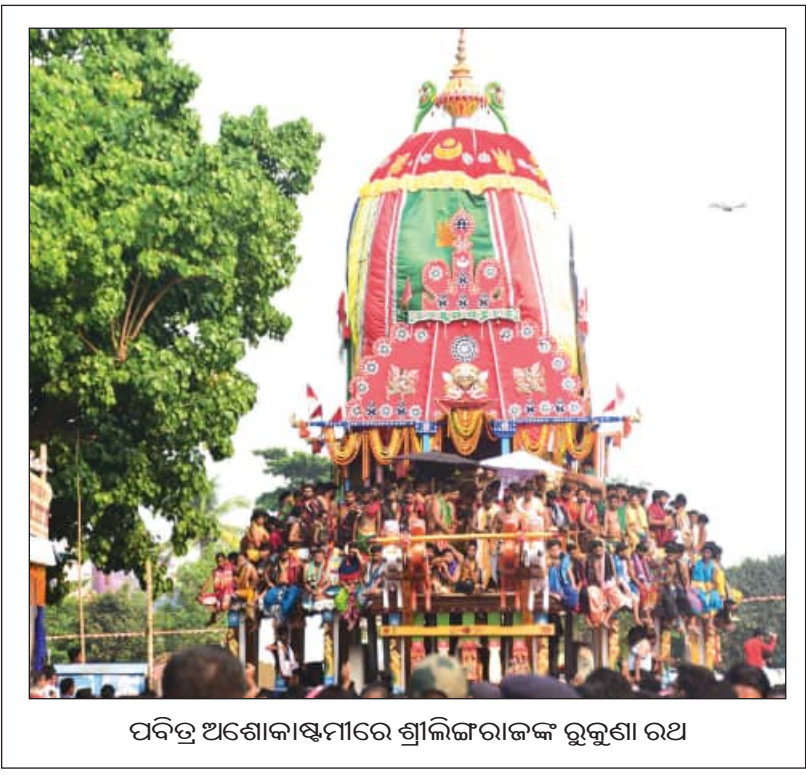
ପବିତ୍ର ଅଶୋକାଷ୍ଟମୀରେ ଶ୍ରୀଲିଙ୍ଗରାଜଙ୍କ ରୁକୁଣା ରଥ