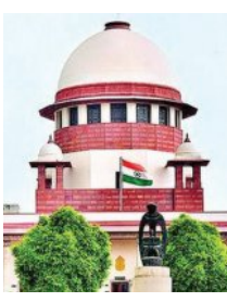
କେବଳ ହିନ୍ଦୁ, ବୌଦ୍ଧ, ଶିଖ୍ ଏସ୍ପି ଜାତିର ଦାବି କରିପାରିବେ