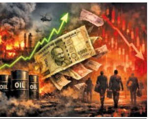
ପୂଣି ଘାରିଲାଣି ଲକ୍ଷ୍ମୀ ଚନ୍ଦ୍ର

■ ନୂଆଦିଲ୍ଲୀ, ୨୪ମାର୍ଚ୍ଚ (ଏକେଡ଼ି): ପୂଣି ଘାରିଲାଣି ଲକ୍ଷ୍ମୀ ଚନ୍ଦ୍ର। ଏଥର କୋଭିଡ୍-୧୯ ଭଳି କୋଣସି ଭୟାବୁ ପାଇଁ ନୁହେଁ, ବରଂ ଶକ୍ତି ସଙ୍କଟ ଯୋଗୁଁ ଏଭଳି ଆଶଙ୍କା ସୃଷ୍ଟି ହୋଇଛି। ମଧ୍ୟପ୍ରାନ୍ତରେ ମହାମୁକ୍ତ ଯୋଗୁଁ ବିଶ୍ୱବ୍ୟାପୀ ତେଲ ଓ ଗ୍ୟାସର ଗୁରୁତର ସଙ୍କଟ ଦେଖାଦେଇଛି। ଯୁଦ୍ଧ ଯୋଗୁଁ ହରମୁକ୍ତ ସମୁଦ୍ର ପଥ ବନ୍ଦ ରହିଛି। ଫଳରେ ଉପସାଗରରୁ ବାହାରକୁ ଯାଇପାରୁନି ଅଣେଇଥିବା ତେଲ ଓ ଗ୍ୟାସ। ଏଭଳି ସ୍ଥିତି ଆଉ କିଛି ଦିନ ଲାଗି ରହିଲେ ଭାରତରେ ମଧ୍ୟ ଲକ୍ଷ୍ମୀ ଚନ୍ଦ୍ର ଲାଗିପାରେ ଏବଂ ଏହାକୁ ଏକ ଲକ୍ଷ୍ମୀ ଚନ୍ଦ୍ର ବୋଲି କୁହାଯିବ। ଅନ୍ୟ ଦେଶମାନଙ୍କରେ ଏଭଳି ଲକ୍ଷ୍ମୀ ଚନ୍ଦ୍ର ଆରମ୍ଭ ହୋଇଗଲାଣି।