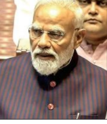
ସର୍ବଦଳାୟ ବୈଠକ ଆଜି

■ ନୂଆଦିଲ୍ଲୀ, ୨୪ମାର୍ଚ୍ଚ (ଏକେଡ଼ି): ପ୍ରଧାନମନ୍ତ୍ରୀ ନରେନ୍ଦ୍ର ମୋଦୀ ଆଜି ରାଜ୍ୟସଭାରେ ଯୁକ୍ତର ଭୟାବହତା ଏବଂ ଭାରତରେ ଉପରେ ପ୍ରଭୁତ୍ୱ ପ୍ରଭାବ ବିଷୟରେ ସତର୍କ କରାଇଛନ୍ତି। ସେ କହିଛନ୍ତି ଯେ ଯଦି ଆମେରିକା-ଇସ୍ରାଏଲ ଏବଂ ଇରାନ ମଧ୍ୟରେ ଯୁଦ୍ଧ ଜାରି ରହେ, ତେବେ ଏହାର ପରିଣାମ ଭୟାବହ ହେବ। ଆଗାମୀ ସମୟ ଦେଶର ସବୁଠାକୁ ବଡ଼ ପରୀକ୍ଷା ନେବ। ହର୍ମୁକ୍ତ ପ୍ରଣାଳୀରେ ଆମର କାହାଜି ଏବଂ ଭାରତୀୟ କୃଷି ସମ୍ପଦମାନେ ଫସି ରହିଛନ୍ତି। ଏହା ଅତ୍ୟନ୍ତ ଚିନ୍ତାଜନକ ବିଷୟ। ଆମର ବାଣିଜ୍ୟିକ ମାର୍ଗ ପ୍ରଭାବିତ ହେଉଛି। ଗ୍ୟାସ୍, ତେଲ ଏବଂ ସାର ଭଳି ଅତ୍ୟାବଶ୍ୟକ ସାମଗ୍ରୀର ଯୋଗାଣ ଉପରେ ଏହାର ପ୍ରଭାବ ପଡ଼ିଛି। ଭାରତ କୃତନୈତିକ ସ୍ତରରେ କାହାଜି ଚଳାଚଳ ସ୍ୱାଭାବିକ କରିବା ପାଇଁ ଚେଷ୍ଟା କରୁଛି।