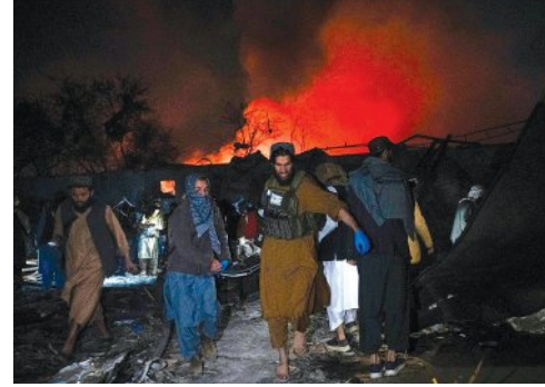
ଆକ୍ରମଣକୁ ଭାରତର ତୀବ୍ର ନିନ୍ଦା

କରିଛନ୍ତି। କୌଣସି ହଫିଙ୍ଗାଲ୍ଲୁ ଟାର୍ଗେଟ୍ କରାଯାଇନାହିଁ। ପାକିସ୍ତାନର ପ୍ରତିରକ୍ଷା ମନ୍ତ୍ରୀ ଶ୍ୱାକା ଆସିଫ୍ ଘୋଷଣା କରିଛନ୍ତି ଯେ, ପାକିସ୍ତାନ ବର୍ତ୍ତମାନ ଆଫଗାନିସ୍ତାନ ସହିତ 'ଖୋଲା ଯୁଦ୍ଧ' ସ୍ଥିତିରେ ରହିଛି। ଗତ ଫେବୃଆରୀ ମାସକୁ ହୁକୁ ଦେଶ ମଧ୍ୟରେ ସାମାନ୍ୟ ବିବାଦକୁ ନେଇ ସଂଘର୍ଷ ଜାରି ରହିଛି, ଯାହା ଗତ ତିନି ସପ୍ତାହ ହେବ ଅଧିକ ଉତ୍ତରଣ ରୂପ ଧାରଣ କରିଛି। କାବୁଲ ମେଡିକାଲରେ ପାକିସ୍ତାନର ବିମାନ ଆକ୍ରମଣକୁ ଭାରତ କଫା ଭାଷାରେ ନିନ୍ଦା କରିଛି। ଏହି ଆକ୍ରମଣକୁ ଭାରତ ବର୍ତ୍ତମାନ ଓ କାପୁରୁଷୋଡ଼ିତ ବୋଲି କହିବା ସହ ଏହା ଆଞ୍ଚଳିକ ଶାନ୍ତି ପ୍ରତି ସିଧାସଳଖ ବିପଦ ବୋଲି ବର୍ଣ୍ଣନା କରିଛି। ଭାରତୀୟ