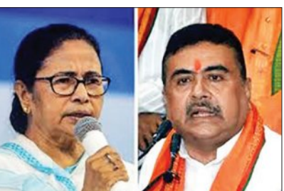
■ ଗତ ଥର ନିର୍ବାଚନରେ ହାରିଥିଲେ ମୁଖ୍ୟମନ୍ତ୍ରୀ ■ ପ୍ରଥମ ତାଲିକା ଜାରି କଲା ଟିଏମସି

କୋଲକାତା, ୧୭ ମାର୍ଚ୍ଚ (ଏକେନି): ନିର୍ବାଚନ କମିଶନ (ଇସି)ଙ୍କ ତାରିଖ ଘୋଷଣା ପରେ ପଶ୍ଚିମବଙ୍ଗରେ ବିଧାନସଭା ନିର୍ବାଚନ ପାଇଁ ଲଢ଼େଇ ଆରମ୍ଭ ହୋଇଯାଇଛି । ବିରୋଧୀ ବିଜେପି ପ୍ରଥମ ପ୍ରାର୍ଥୀ ତାଲିକା ଘୋଷଣା କରିବା ପରେ ଗଣସଭା ଟିଏମସି ମଧ୍ୟ ସମାନ ପଦକ୍ଷେପ ଗ୍ରହଣ କରିଛି । ମୋଟ ୨୯୪ ଆସନରୁ ୨୯୧ଟି ପାଇଁ ପ୍ରାର୍ଥୀଙ୍କ ନାମ ଘୋଷଣା କରିଛି । ଅନ୍ୟ ବିନୋଟି ଆସନ ସହଯୋଗୀ ବିଜେପିଏମ ପାଇଁ ଟିଏମସି ଛାଡ଼ି ଦେଇଛି । ଗତ ବିଧାନସଭା ନିର୍ବାଚନ ପରି ଚଳିତ ଥର ମଧ୍ୟ ଦୁଇ ପୂର୍ବତନ ସହଯୋଗୀଙ୍କ ମଧ୍ୟରେ କଡ଼ା ମୁକାବିଲା ଦେଖିବାକୁ ମିଳିବ । ନିଜର ପୂର୍ବତନ ସହଯୋଗୀ ତଥା ବିଜେପି ନେତା ଶୁଭେନ୍ଦୁ ଅଧିକାରୀଙ୍କ ବିରୋଧରେ ଲଢ଼ିବାକୁ ମୁଖ୍ୟମନ୍ତ୍ରୀ ମମତା ବାନାର୍ଜୀ ନିଷ୍ପତ୍ତି ନେଇଛନ୍ତି । ମମତା ଭବାନୀପୁରକୁ ଲଢ଼ିବେ । ସାମ୍ବାଦିକ ସମ୍ମିଳନୀରେ ମମତା କହିଥିଲେ ଯେ ବିଜେପି କାହିଁକି ତରୁଛି? ଯଦି ଲଢ଼ିବୁକୁ ଚାହୁଁଛେ ତେବେ ଗ୍ୟାସ ସଙ୍କଟ ସୃଷ୍ଟି କରନାହିଁ । ମୋକାସୁ ଓହ୍ଲାଇ ସଠିକ ଭାବେ ମୁକାବିଲା କର । ଏହି ବିଧାନସଭା ନିର୍ବାଚନ ରାଜ୍ୟ ଅସ୍ଥିର ଲଢ଼େଇ । ଏଥିରେ ପଶ୍ଚିମବଙ୍ଗ ହିଁ ଜିତିବ । ଦିଲ୍ଲୀର ଲଢ଼ି ପରାଜିତ ହେବ । ଚଳିତ ଥର ଟିଏମସିରେ ସେଲିବ୍ରିଟିକୁ ବିଶେଷ ପ୍ରାଧାନ୍ୟ ଦେଇନାହିଁ । ତୁଣ୍ଡମୁକ୍ତର ନେତା ଏବଂ କର୍ମୀଙ୍କ ଉପରେ ଦକ ଭରସା ପ୍ରକଟ କରିଛି । ୨୦୨୧ରେ ଟିଏମସି ୧୫ ସେଲିବ୍ରିଟିକୁ ଟିକଟ ଦେଇଥିଲା । ମାତ୍ର ଚଳିତ ଥର କେବଳ ୨ ଜଣଙ୍କୁ ଟିକଟ ମିଳିଛି । ସେହିପରି ୪୨ ମହିଳାଙ୍କୁ ପ୍ରାର୍ଥୀ