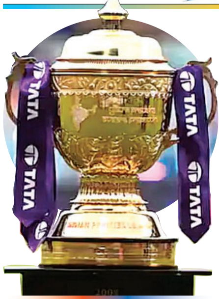
ନୂଆଦିଲ୍ଲୀ, ୧୩ମାର୍ଚ୍ଚ (ଏକେଡ୍):

ଭାରତରେ କ୍ରିକେଟର ଲୋକପ୍ରିୟତା ସର୍ବାଧିକ । ଯାହା ଫଳରେ କ୍ରିକେଟପ୍ରେମୀ ସର୍ବଦା ସେମାନଙ୍କ ପ୍ରିୟ ଖେଳାଳି ଓ ଟିମ୍ ସମ୍ପର୍କରେ ଖବର ରଖିଥାନ୍ତି । ନିକଟରେ ଭାରତ ଓ ଶ୍ରୀଲଙ୍କାରେ ଟି-୨୦ ବିଶ୍ୱକପ ୧୦ମ ଫେବୃଆରୀ ଅନୁଷ୍ଠିତ ହୋଇଯାଇଛି । ଏଥିରେ ଘରୋଇ ଦଳ ଭାବେ ଭାରତ ପ୍ରଥମଥର ଚାମ୍ପିଅନ ହୋଇଛି । ଏହା ଭାରତୀୟ ସମର୍ଥକଙ୍କୁ ବେଶ ଆନନ୍ଦ ଦେଇଛି । ଇରାନ ବନାମ ଇଣ୍ଡିଆର ଖେଳାଳିଙ୍କୁ ଫୁଲ ଫାଇରରେ ତିନି ଓ ଇନ୍ଦିଆର ଖେଳାଳିଙ୍କୁ ଫୁଲ ଫାଇରରେ ତିନି ଦଳର ତୃତୀୟ ଟାଇଟଲ ବିଜୟକୁ ଉତ୍ସବ ଭାବେ ପାଳନ କରିଛନ୍ତି । ଭାରତୀୟ ଦଳର ମଧ୍ୟ ବେଶ ଲାଜବାନ ହୋଇଛି । କ୍ରିକେଟ ଖେଳ ହେଲେ ଅନେକ ବ୍ୟକ୍ତି ଓ ପେସାଦାରଙ୍କ ଘର ଚଳୁଛି । ଏହା କେବଳ ଖେଳାଳି କିମ୍ବା ଏହାକୁ ପରିଚାଳନା କରୁଥିବା ବ୍ୟକ୍ତିଗଣଙ୍କ ଆୟର ମାଧ୍ୟମ ହୋଇ ରହିନାହିଁ । ସମାଜର ଅନେକ ଶ୍ରେଣୀର ଲୋକ ଓ ସରକାର କ୍ରିକେଟ ଖେଳକୁ ଲାଜବାନ ହେଉଛନ୍ତି । ଭାରତ ସରକାର ଓ ଭାରତୀୟ ସମାଜକୁ ସବୁଠାରୁ ଅଧିକ ଲାଭ ମିଳିଥାଏ ଇଣ୍ଡିଆନ ପ୍ରିମିୟର ଲିଗ୍ ଘରୋଇ ଟି-୨୦ କ୍ରିକେଟରେ । ଏବେ ଟି-୨୦ ବିଶ୍ୱକପ ପରେ ଭାରତୀୟ ଦଳର କାର୍ଯ୍ୟକ୍ରମ ମଧ୍ୟ ପର୍ଯ୍ୟନ୍ତ ନାହିଁ । ଏହି ସମୟରେ ଅର୍ଥାତ୍ ମାର୍ଚ୍ଚ ୨୮ ରୁ ମେ ୩୧ ତାରିଖ ମଧ୍ୟରେ ଇଣ୍ଡିଆନ ପ୍ରିମିୟର ଲିଗ୍ ଖେଳାଯିବ । ଏବେ ଭାରତୀୟ ତଥା ବିଶ୍ୱର କିଛି କ୍ରିକେଟପ୍ରେମୀଙ୍କ ନଜର ଏହି ଚୁର୍ଣ୍ଣାମେଣ୍ଟ ଉପରେ ରହିବ । ଆଇପିଏଲର ଚାରୁ ପ୍ରତିସ୍ପନ୍ଧିତା, ପ୍ରତ୍ୟେକ ମ୍ୟାଚ୍ରେ ରୋମାଞ୍ଚ ଓ ରେକର୍ଡ କ୍ରିକେଟପ୍ରେମୀଙ୍କୁ ଖୁବ୍ ଆଗେଇତ କରିବ । ଆଇପିଏଲ୍ ଏପରି ନିଶ୍ଚିତ ଲୋକପ୍ରିୟତାର ଆଇ ଏକ ରେକର୍ଡ ଭାଙ୍ଗିବ ବୋଲି ଆଶା କରାଯାଉଛି । ଆଇପିଏଲର ଚଳିତ ଫେବୃଆରୀରେ ପୂର୍ବପରି ୧୦ଟି