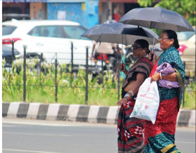
ଧୂଧୁ ଖରାବେଳେ ରାଜଧାନୀ ରାଜରାଷ୍ଟ୍ର