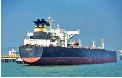
ପଡ଼ୋଶୀ ଦେଶକୁ ଇରାନର ଧମକ

■ ଚେହେରାନ, ୧୨।୩ (ଏକ୍ସପ୍ରେସ୍): ମଧ୍ୟପ୍ରାନ୍ତରେ ଆମେରିକା- ଇସ୍ରାଏଲ ଓ ଇରାନ ମଧ୍ୟରେ ଚାଲିଥିବା ଉଦ୍ଧାରଣ ଯୁଦ୍ଧ ଏବେ ଉଦ୍ଧାରଣ ଦିନରେ ପହଞ୍ଚିଛି। ଦୁଇ ପକ୍ଷ ପରସ୍ପର ଉପରେ ଆକ୍ରମଣ ଓ ପ୍ରତ୍ୟାକ୍ରମଣ କରି ରଖୁଥିବା ବେଳେ ସମଗ୍ର ଆଞ୍ଚଳିକ ସ୍ତରରେ ଉଦ୍ଧାରଣ ଯୁଦ୍ଧ ହେଉଛି। ୨ ହଜାରରୁ ଅଧିକ ଲୋକ ପ୍ରାଣ ହରାଇଥିବା ବେଳେ ୧୦ ହଜାରରୁ ଅଧିକ ଲୋକ ଆହତ ହେଲେଣି। ଆକ୍ରମଣର ଲକ୍ଷ୍ୟ ହାସଲ ହୋଇ ସାରିଛି ଏବଂ ଯେକୌଣସି ପୁରୁଷ୍କୃତ ଯୁଦ୍ଧ ବନ୍ଦ ହେବ ବୋଲି ଆମେରିକା ରାଷ୍ଟ୍ରପତି ଟ୍ରମ୍ପ କହୁଥିବା ବେଳେ ଇରାନର ଉଗ୍ର ଆଭିମୁଖ୍ୟ ପରିସ୍ଥିତିକୁ ଜଟିଳ କରିବାରେ ଲାଗିଛି। ଇରାନ ଆଜି ଘୋଷଣା କରିଛି ଯେ ଆମେରିକା ଓ ଇସ୍ରାଏଲ ଯୁଦ୍ଧ ଆରମ୍ଭ କରିଥିଲେ, କିନ୍ତୁ ଯଦି ସେମାନେ ଯୁଦ୍ଧ ବନ୍ଦ କରିବାକୁ ଚାହୁଁଛନ୍ତି, ତାହାହେଲେ ଇରାନ ସର୍ତ୍ତରେ ଯୁଦ୍ଧ ବନ୍ଦ ହେବ। ଇରାନର ରାଷ୍ଟ୍ରପତି ମସୁଦ ପେଜେସବିଆନ ସାମାଜିକ ଗଣମାଧ୍ୟମ ଏକ୍ସରେ ସର୍ତ୍ତ ସମ୍ପର୍କରେ ସୂଚନା ଦେଇଛନ୍ତି। ଯୁଦ୍ଧ ବନ୍ଦ ପାଇଁ ଇରାନ