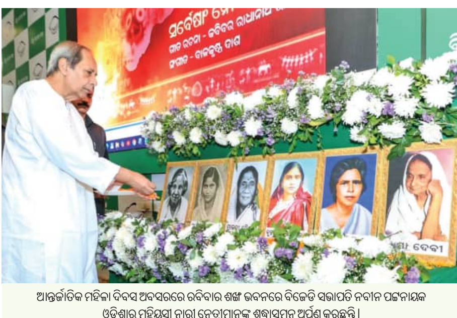
ଆନ୍ତର୍ଜାତିକ ମହିଳା ଦିବସ ଅବସରରେ ରବିବାର ଶଙ୍ଖ ଭବନରେ ବିକେନ୍ଦ୍ରି ସଭାପତି ନବୀନ ପଟ୍ଟନାୟକ ଓଡ଼ିଶାର ମହିଳା ନାରୀ ନେତ୍ରୀମାନଙ୍କୁ ଶ୍ରଦ୍ଧାଘୂମନ ଅର୍ପଣ କରୁଛନ୍ତି।