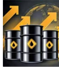
ଦୀର୍ଘ ସମୟ ଧରି ଲାଗି ରହିବ ଅନିଶ୍ଚିତତା

■ ନୂଆଦିଲ୍ଲୀ, ୮ମା (ଏକେନ୍ଦ୍ରି): ଇରାନ-ଇସ୍ରାଏଲ ଯୁଦ୍ଧ କମିବାର କୌଣସି ସଙ୍କେତ ଦେଖାଯାଉନାହିଁ। ଏହି ଯୁଦ୍ଧରେ ଆମେରିକା ମଧ୍ୟ ଇସ୍ରାଏଲ ସହତ ହେବ। ବର୍ତ୍ତମାନ ସୁଦ୍ଧା ଉତ୍ତରୀୟ ଦେଶରେ ପର୍ଯ୍ୟନ୍ତ ପହଞ୍ଚିଛି। ଆମେରିକା ରାଷ୍ଟ୍ରପତି ତୋନାଲ୍ଡ ଟ୍ରମ୍ପ କହିଛନ୍ତି ଯେ ଏହି ଯୁଦ୍ଧ ଦୀର୍ଘକାଳୀନ ହୋଇପାରେ, ଯାହା ବିଶ୍ୱରେ ଅଶାନ୍ତତା ତୈଳ ମୂଲ୍ୟରେ ଡାକ୍ତା ବୃଦ୍ଧି ଆଣିବ। ଏଥିଯୋଗୁ ଭାରତର ଅର୍ଥନୀତି ପ୍ରଭାବିତ ହେବାର ସମ୍ଭାବନା ରହିଛି।