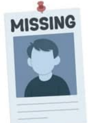
ସ୍ଥାନରେ। ୨୦୨୫ ଜାନୁଆରୀ ୩୧ ତାରିଖରୁ ୨୦୨୬ ଜାନୁଆରୀ ୩୧ ମଧ୍ୟରେ ସାରା ଦେଶରେ ପଞ୍ଚିକୃତ ନିଖୋଜ

ପିଲାମାନଙ୍କ ମଧ୍ୟରୁ ୫୩୬ ଜଣଙ୍କୁ ସୁରକ୍ଷିତ ଭାବରେ ଉଦ୍ଧାର କରାଯାଇ ପାରିଛି। ଏବେ ବି ୧୦୮୮ ଶିଶୁଙ୍କର ପରା ମିଳିନାହିଁ। ସବୁଠାରୁ ସର୍ବାଧିକ ବିଷୟ ହେଉଛି ଶିଶୁ ନିଖୋଜ ମାମଲା କ୍ଷେତ୍ରରେ ଓଡ଼ିଶା ସାରା ଦେଶର ଶ୍ରେଷ୍ଠ ୫ କୁଖ୍ୟାତ ରାଜ୍ୟରେ ସ୍ଥାନ ପାଇଛି। ନିଖୋଜ ଶିଶୁ ମାମଲାରେ ପଶ୍ଚିମବଙ୍ଗ ଦେଶରେ ପ୍ରଥମ ସ୍ଥାନରେ ରହିଛି ଓ ମଧ୍ୟପ୍ରଦେଶ ଦ୍ୱିତୀୟ