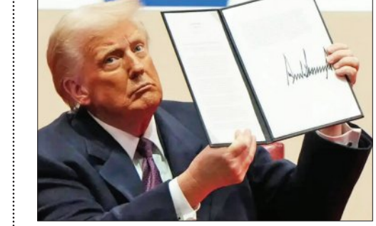
୧୬୫ ବର୍ଷର ପରମ୍ପରା ଭାଙ୍ଗିବ

ସେଠାରେ ସ୍ଥଳଭାଗରେ ଲ୍ୟାଣ୍ଡିଙ୍ଗ୍, ସମୁଦ୍ରରେ ମାଉସୁ ଏବଂ ଅଧ୍ୟାଧୁନିକ ମିଆଇଲ ସିଷ୍ଟମ ପ୍ରଦାନ କରାଯାଇଛି । ଗାଲିପୋଲି ଭଳି ଇରାନର ଉପକୂଳବର୍ତ୍ତୀ ଅଞ୍ଚଳ ମଧ୍ୟ ପାହାଡ଼ିଆ । ଏଠାରେ ଆମେରିକାର ସୈନ୍ୟମାନେ ସହଜରେ ଶତ୍ରୁର ଚାଲେଟ ହୋଇପାରନ୍ତି । ହର୍ମୁଜ ପ୍ରଶାଳାରେ ମାତ୍ର ୨୨ କିମି ଚଉଡ଼ା ଜଳପଥରେ ଇରାନର ଶତାଧିକ ଡ୍ରୋନ୍, ମିଆଇଲ ବୋଟି ଏବଂ ଆଣ୍ଟିସିପ୍ ମିଆଇଲ ମୁତ୍ତରେ ଅଛି, ଯାହା ଆମେରିକାର ବଡ଼ ଯୁଦ୍ଧ ଜାହାଜ ପାଇଁ ମରଣାସତ୍ତା ସୃଷ୍ଟି ହେବ । ଟ୍ରମ୍ପ ଏହି ଅଭିଯାନକୁ ଏକ 'ଇକ୍ସପ୍ରେସ୍' ପଦକ୍ଷେପ ବୋଲି କହୁଥିବା ବେଳେ, ଇତିହାସ କୁହେ ଯେ ଶତ୍ରୁକୁ ଦୁର୍ବଳ ମନେ କରିବା ବିପଜ୍ଜନକ ହୋଇପାରେ । ଯଦି ଏହି ଯତ୍ନରେ ଆମେରିକା ପସିଯାଏ, ତେବେ ଏହା ଆଉ ଏକ 'ପର୍ସିଆନ ଗାଲିପୋଲି' ଭଳି ଇତିହାସରେ ଲିପିବଦ୍ଧ ହେବ ।