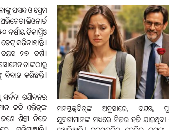
ମନସ୍ତତ୍ତ୍ୱବିତ୍ ଅନୁସାରେ, ବୟସ୍କ ପୁରୁଷମାନେ କମ୍ ବୟସ୍କ ମହିଳାଙ୍କ ପସନ୍ଦ କରନ୍ତି ।