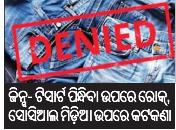
କିନ୍ତୁ ଚିହାର୍ଟ ପିକିଆ ଉପରେ କଟକଣା ସୋସିଆଲ ମିଡ଼ିଆ ଉପରେ କଟକଣା

ସିମଲା, ୧୮ ମାର୍ଚ୍ଚ (ଏକେନ୍ଦ୍ରି): ହିମାଚଳ ସରକାର ନିଜ କର୍ମଚାରୀଙ୍କ ପାଇଁ ଏକ କଠୋର ନିୟମାବଳୀ ଜାରି କରିଛନ୍ତି। ଏଣିକି ସରକାରୀ କାର୍ଯ୍ୟାଳୟରେ କର୍ମଚାରୀମାନେ କିନ୍ତୁ, ଚିହାର୍ଟ କିମ୍ବା ପାର୍ଟି ଓୟାର ପିନ୍ଧି ପାରିବେ ନାହିଁ। କର୍ମଚାରୀ ବିଭାଗ ପକ୍ଷରୁ ଜାରି ହୋଇଥିବା ଏହି ନିର୍ଦ୍ଦେଶନାମାରେ ଡ୍ରେସ କୋଡ୍ ସହ ସୋସିଆଲ ମିଡ଼ିଆ ବ୍ୟବହାର ଉପରେ ମଧ୍ୟ କଟକଣା ଲଗାଯାଇଛି। ପୁରୁଷ କର୍ମଚାରୀମାନେ କେବଳ ଫର୍ମାଲ ସାର୍ଟ, ପ୍ୟାଣ୍ଟ ଓ ଟ୍ରାଉଜର ପିନ୍ଧି ଆସିବାକୁ ନିର୍ଦ୍ଦେଶ ଦିଆଯାଇଛି। ସେହିପରି ମହିଳା କର୍ମଚାରୀମାନଙ୍କ ପାଇଁ ଶାଢ଼ି, ସାଲ୍‌ୱାର୍ - ସୁଟ୍ ଓ ଅନ୍ୟାନ୍ୟ ଫର୍ମାଲ ପୋଷାକ ନିର୍ଦ୍ଦିଷ୍ଟ କରାଯାଇଛି। ସରକାରୀ କାର୍ଯ୍ୟାଳୟରେ ଅନୁଶାସନ, ଗାରିମା ଓ ପେସାଦାର ଭାବମୂର୍ତ୍ତି ବଜାୟ ରଖିବା ପାଇଁ ଏହି ପଦକ୍ଷେପ ନିଆଯାଇଛି ବୋଲି କୁହାଯାଇଛି। ଡ୍ରେସ କୋଡ୍ ସହିତ ସରକାର ସୋସିଆଲ ମିଡ଼ିଆ ବ୍ୟବହାର ପାଇଁ ସ୍ପଷ୍ଟ ନିର୍ଦ୍ଦେଶ ଦେଇଛନ୍ତି। କୌଣସି ସରକାରୀ ନୀତି ଉପରେ କର୍ମଚାରୀମାନେ ସର୍ବସାଧାରଣରେ ନିଜର ବ୍ୟକ୍ତିଗତ ମତାମତ ଦେଇପାରିବେ ନାହିଁ। ରାଜନୈତିକ କିମ୍ବା ଧାର୍ମିକ ବିତ୍ତ୍ୱରୁ ଦୂରରେ ରହିବାକୁ ନିର୍ଦ୍ଦେଶ ଦିଆଯାଇଛି। ସରକାର କିମ୍ବା ଅନୁଷ୍ଠାନର ଭାବମୂର୍ତ୍ତି ଖରାପ କରୁଥିବା ଭଳି କୌଣସି ପୋଷ୍ଟ କଲେ ଶୁଖିଳାଗତ କାର୍ଯ୍ୟାନୁଷ୍ଠାନ ଗ୍ରହଣ କରାଯିବ। ଏହାକୁ ପାଳନ ନ କଲେ କଡ଼ା କାର୍ଯ୍ୟାନୁଷ୍ଠାନ ଗ୍ରହଣ କରାଯିବ। ପୂର୍ବରୁ ୨୦୧୨ରେ ମଧ୍ୟ ଏଭଳି ନିର୍ଦ୍ଦେଶ ଦିଆଯାଇଥିଲା। କିନ୍ତୁ ଏଥର ଏହାକୁ ଆହୁରି କଡ଼ାକଡ଼ି କରାଯାଇଛି। ହିମାଚଳରେ ମୋଟ ଉପରେ ପ୍ରାୟ ୨, ୨୦ ଲକ୍ଷ ସରକାରୀ କର୍ମଚାରୀ ରହିଛନ୍ତି।