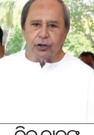
ବିଜୁ ବାବୁଙ୍କ ନାମରେ ଟ୍ରଷ୍ଟ ଖୋଲିବାକୁ ନିଷ୍ପତ୍ତି ନେଇଥିଲେ

■ ଭୁବନେଶ୍ଵର, ୧୮ ମାର୍ଚ୍ଚ (ସମ୍ପାଦକ): ଗଣମାଧ୍ୟମରେ ବିଜୁ-ନବୀନ ଇନ୍‌ସ୍ପିରେସନାଲ ନାମରେ ବିଭିନ୍ନ ଖବର ପ୍ରକାଶ ପାଇଥିବା ବେଳେ ଏନେଇ ମୁହିଁ ଖୋଲିଛନ୍ତି ବିରୋଧୀ ଦଳ ନେତା ନବୀନ ପଟ୍ଟନାୟକ । ବିଜୁ ବାବୁଙ୍କ ନାମରେ ଏକ ଟ୍ରଷ୍ଟ ଖୋଲିବାକୁ ନିଷ୍ପତ୍ତି ନେଇଥିଲେ, ଯାହାକି ଓଡ଼ିଶାର ଜନସାଧାରଣଙ୍କ ହିତ ପାଇଁ ଉଦ୍ଦିଷ୍ଟ ବୋଲି ନବୀନ ସ୍ପଷ୍ଟ କରିଛନ୍ତି । ଗଣମାଧ୍ୟମକୁ ବୁଧବାର ଏନେଇ ପ୍ରତିକ୍ରିୟା ଦେଇ ନବୀନ କହିଛନ୍ତି ଯେ ବିଜୁ ବାବୁ ଅନ୍ୟାନ୍ୟ ଗୁଣ ସହିତ ପରୋପକାରୀ ହେବା ଫଳରେ ଏକ ଟ୍ରଷ୍ଟ ଖୋଲିବାକୁ ନିଷ୍ପତ୍ତି ନେଇଥିଲେ ।