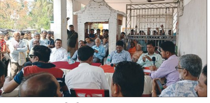
ପ୍ରକାଶ୍ୟରେ ଚନ୍ଦନେଶ୍ଵର ମନ୍ଦିର ନିକଟରେ ନିଲାମ ପାଇଁ ବ୍ରହ୍ମ ବୋର୍ଡ ପକ୍ଷରୁ ବିକ୍ଷିପ୍ତ କାର୍ଯ୍ୟ ହୋଇଥିଲା। ଗତ ଗୁରୁବାର ଦିନ ଗାଡି ପାଇଁ ୪୦ ଲକ୍ଷ ୫୫ହଜାର, ଜୋଡା ଷ୍ଟାଣ୍ଡକୁ ୧୫୫ ୧୦ହଜାର ୫୦୦, ଭୋଗ ଦୋକାନ ବାବଦକୁ ୨୫୫ ୬୫ହଜାର, ଧୂପପୁଣା ଉତ୍ସବ ୧୫୫ ୪୯ହଜାର ଟଙ୍କାରେ ବ୍ରହ୍ମ ବୋର୍ଡ ପକ୍ଷରୁ ନିଲାମ ଦିଆଯାଇଥିଲା। ଅନ୍ୟ