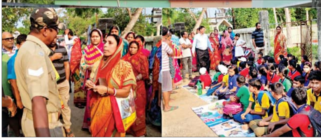
ବାସୁଦେବପୁର, ୨୮ ମାର୍ଚ୍ଚ (ସମ୍ପାଦକ)

ପାଟକରେ ପଢ଼ିଲା ତାଲା। ସ୍କୁଲକୁ ଆସି ଠିଆ ହୋଇ ରହିଲେ ଛାତ୍ରଛାତ୍ରୀ। ୨ ଘଣ୍ଟା ଧରି ଅପେକ୍ଷା କଲେ। ଦେଶର ଭାଗ୍ୟ ଉଦ୍ଧାର କରିବା ପାଇଁ ଛାତ୍ରଛାତ୍ରୀ ବସି ରହିଲେ ରାସ୍ତା ଉପରେ।